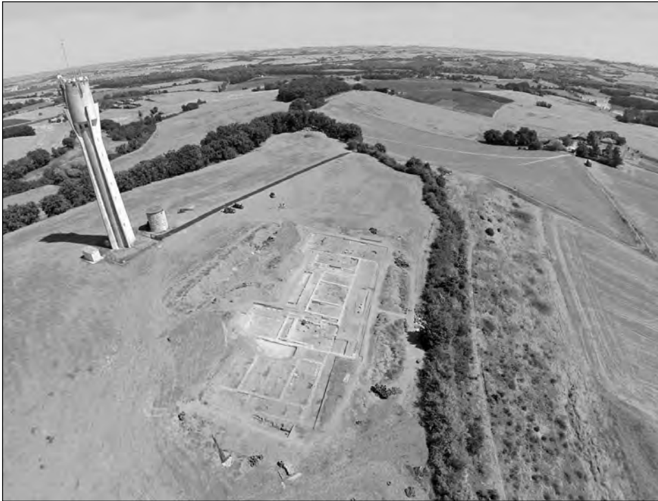
Fig. 2 : Vue générale du site depuis l'ouest