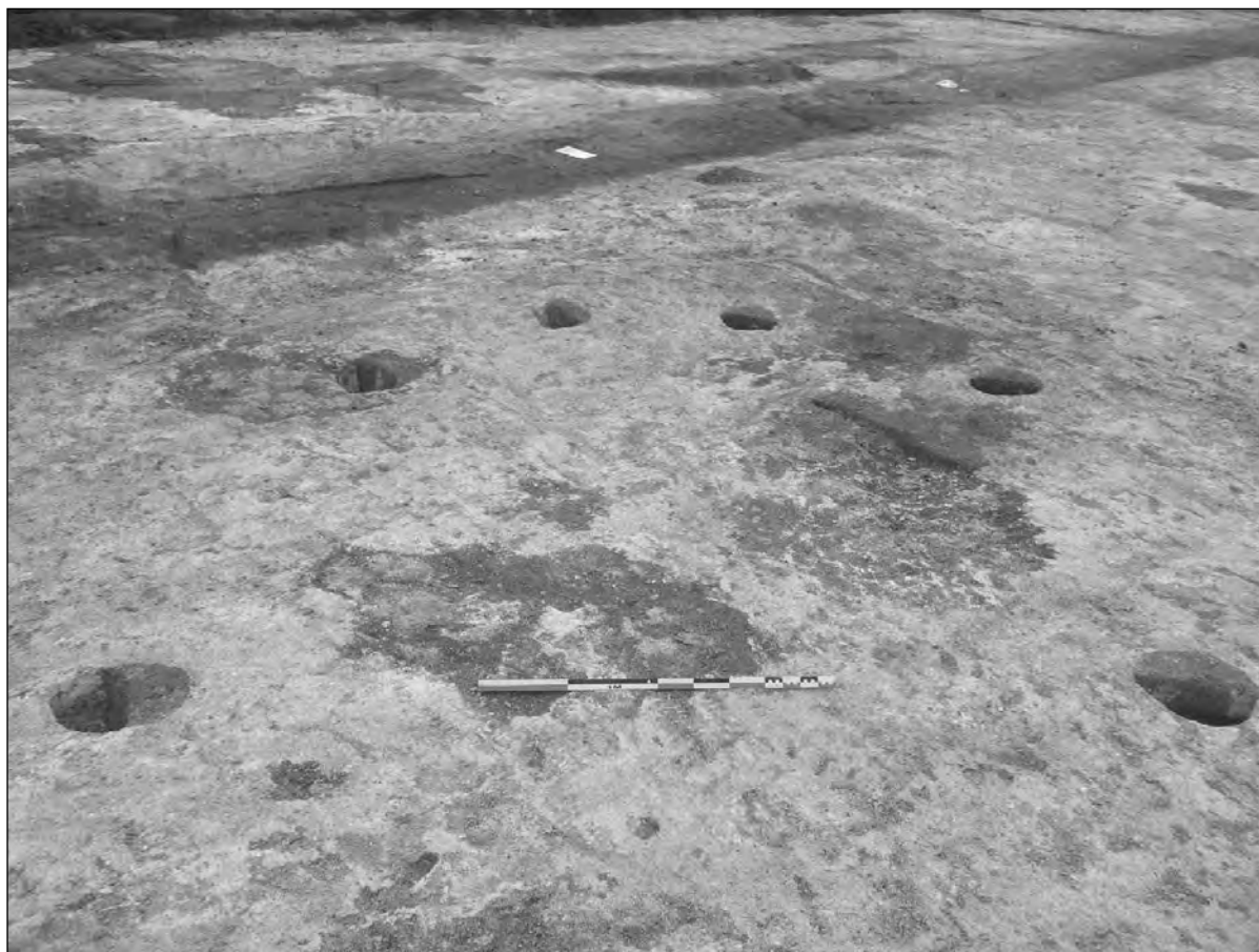
Fig. 3 : Vue oblique vers l'ouest du bâtiment sur poteaux faisant face à l'entrée de l'enclos sud.