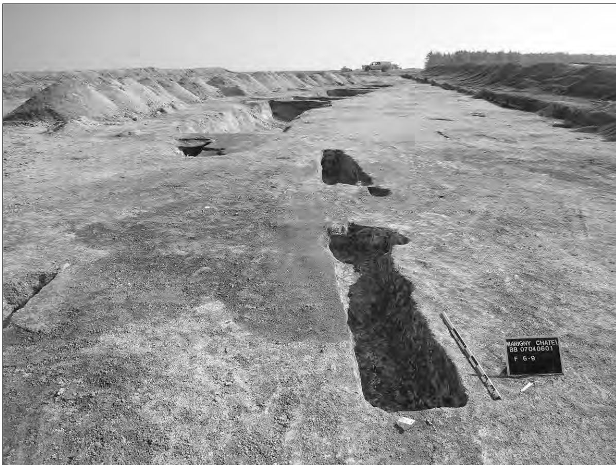
Fig. 2 : Vue oblique du système d'entrée de l'enclos sud, en tranchées palissadées.