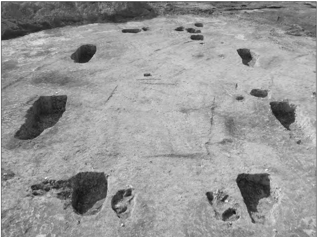
Fig. 4 : Vue oblique vers le sud-ouest du grand bâtiment sur poteaux de l'enclos nord, après fouille.

A La Tène D1, alors que les fossés d'enclos sont pratiquement comblés, l'habitat connaît un déplacement vers le nord avec une refondation du système d'enclos. Celui-ci est cette fois de forme quadrangulaire : deux fossés rectilignes et parallèles sont renseignés par la fouille et l'imagerie satellitaire, ils délimitent un espace d'au moins 1 ha (soit la superficie de l'enclos précédent). Le système d'entrée, non retrouvé, pourrait se situer encore une fois à l'est. Les fossés documentés, au profil en V, sont de taille modeste et comparables aux tronçons nord et sud de l'enclos précédent ; au maximum, 1,26 de largeur et 0,58 m de profondeur pour le fossé sud, et 1,34 de largeur pour 0,68 m de profondeur pour le fossé nord. A l'intérieur de l'enclos, l'espace fouillé a révélé deux bâtiments sur poteaux, de plan à module central quadrangulaire et parois rejetées (sur ce type de bâtiment, voir Maguer 2005). Contre le fossé sud, le plus grand (voir Fig. 4) pourrait constituer le bâtiment principal de l'établissement étant donné ses dimensions et la puissance de ses poteaux porteurs (2,43 m de longueur moyenne, 0,69 m de profondeur moyenne). Les quatre plus gros trous de poteaux délimitent