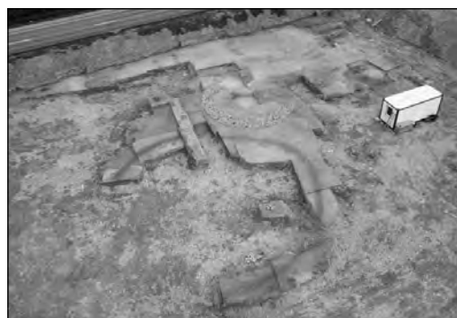
Fig. 1 : vue de l'ensemble funéraire d'Orny en direction du Nord.

Le projet d'ouverture d'une nouvelle gravière sur la commune d'Orny, au lieu-dit Sous-Mormont , a déterminé le diagnostic archéologique d'une parcelle de 3,6 hectares menacée par les travaux d'extraction. La proximité immédiate de plusieurs occupations, telles que le site laténien du Mormont, ou la villa et la nécropole gallo-romaines d'Orny, justifiait l'évaluation de ce secteur, dont le potentiel archéologique était encore inconnu. L'opération a permis d'identifier plusieurs indices d'occupation, notamment une sépulture à incinération datée du HaD1, qui a livré des éléments de parure en bronze déformés par le feu. Il s'agit des fragments d'un disque ajouré à renflement central, entouré de cercles mobiles à décor de chevrons incisés, ainsi que des restes d'un brassard-tonnelet. Ces résultats ont conduit la Section d'archéologie cantonale à prescrire trois campagnes de fouille préventive, réalisées entre 2012 et 2014 1 . Celles-ci ont révélé plusieurs foyers à pierres chauffées, ainsi que de nombreuses structures de combustion suggérant une phase de brûlis dont la datation n'est pas encore établie. Les investigations ont également permis la découverte inattendue d'un ensemble funéraire de La Tène ancienne, dont l'étude est en cours (fig. 1).