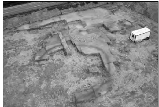
Fig. 1 : vue de l'ensemble funéraire d'Orny en direction du Nord (cliché O. Feihl, Archeotech).

Le projet d'ouverture d'une nouvelle gravière sur la commune d'Orny, au lieu-dit Sous-Mormont , a déterminé le diagnostic archéologique d'une parcelle de 3,6 hectares menacée par les travaux d'extraction. La proximité immédiate de plusieurs occupations, telles que le site laténien du Mormont, ou la villa et la nécropole gallo-romaines d'Orny, justifiait l'évaluation de ce secteur, dont le potentiel archéologique était encore inconnu. L'opération a permis d'identifier plusieurs indices d'occupation, notamment une sépulture à incinération datée du HaD1, qui a livré des éléments de parure en bronze déformés par le feu. Il s'agit des fragments d'un disque ajouré à renflement central, entouré de cercles mobiles à décor de chevrons incisés, ainsi que des restes d'un brassard-tonnelet. Ces résultats ont conduit la Section d'archéologie cantonale à prescrire trois campagnes de fouille préventive, réalisées entre 2012 et 2014 1 . Celles-ci ont révélé plusieurs foyers à pierres chauffées, ainsi que de nombreuses structures de combustion suggérant une phase de brûlis dont la datation n'est pas encore établie. Les investigations ont également permis la découverte inattendue d'un ensemble funéraire de La Tène ancienne, dont l'étude est en cours (fig. 1).