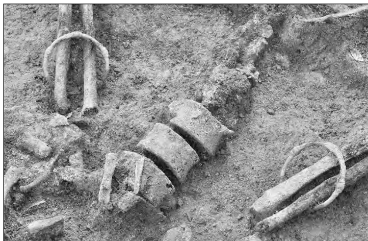
Fig. 6 : tombe ST 225. Détail de deux anneaux à nodosités en bronze portés aux poignets.