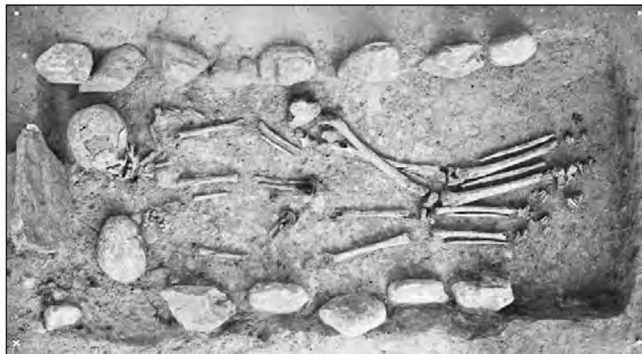
Fig. 5 : tombe ST 238. Inhumation double de deux enfants dans un contenant large délimité par un entourage de pierres.