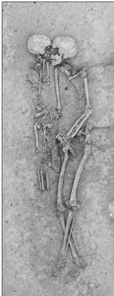
Fig. 4 : tombe ST 244. Inhumation double d'un adulte et d'un enfant dans un contenant de type monoxyle.