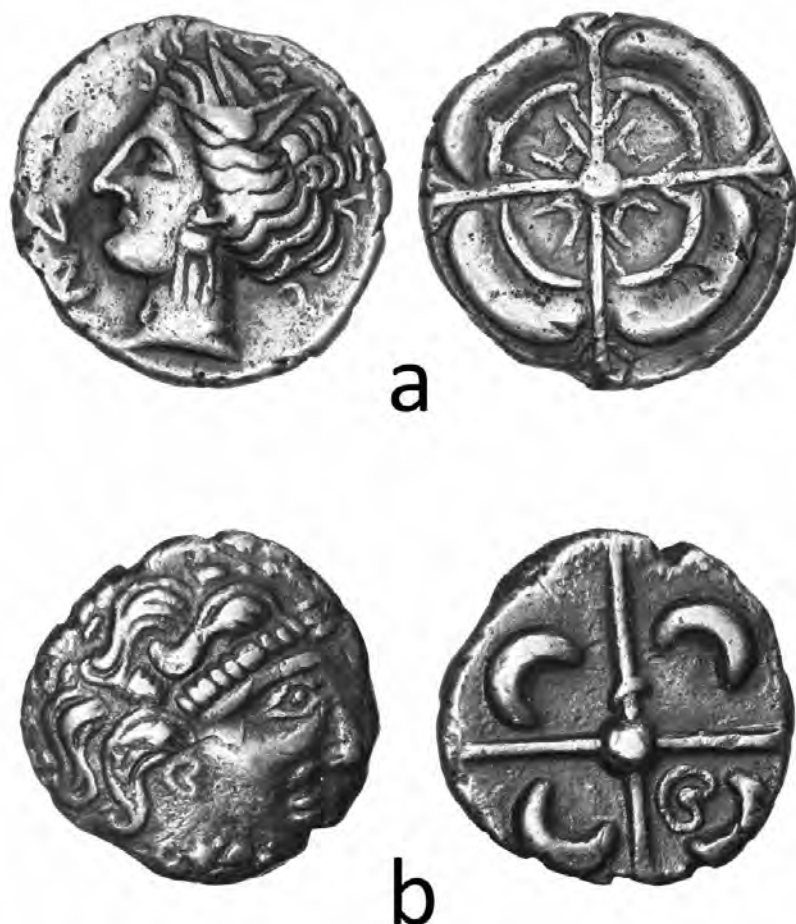
Fig.1 : a- Imitation de drachme de Rhodè ; b- Monnaie à la croix.

exemple en milieu rural, où les échanges échappent visiblement à la sphère monétaire. Ainsi, nonobstant une implication croissante des populations dans les échanges monétarisés, à aucun moment ces pratiques n'affectent uniformément l'ensemble des strates sociales.