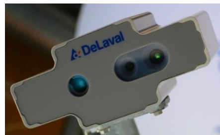
Figure 2 : Le nouveau capteur DeLaval, qui permet de calculer la NEC

Il serait bien évidemment trop long et inutiles de détailler tous les capteurs présents sur le robot laitier, c'est pourquoi nous détaillerons uniquement les processus dans lesquels les capteurs entrent en jeu.