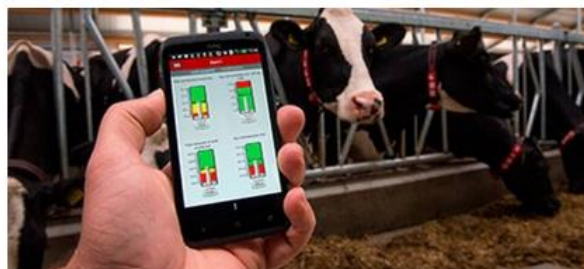
Figure 5 : Des alertes sont envoyés à l'éleveur en cas de problèmes, où une prise de décision est nécessaire

Cette prise de décision, bien que parfois contraignante, est une sécurité, afin d'éviter une erreur de gestion du troupeau, ou une action qui pourrait fragiliser la production laitière ou blesser un animal.