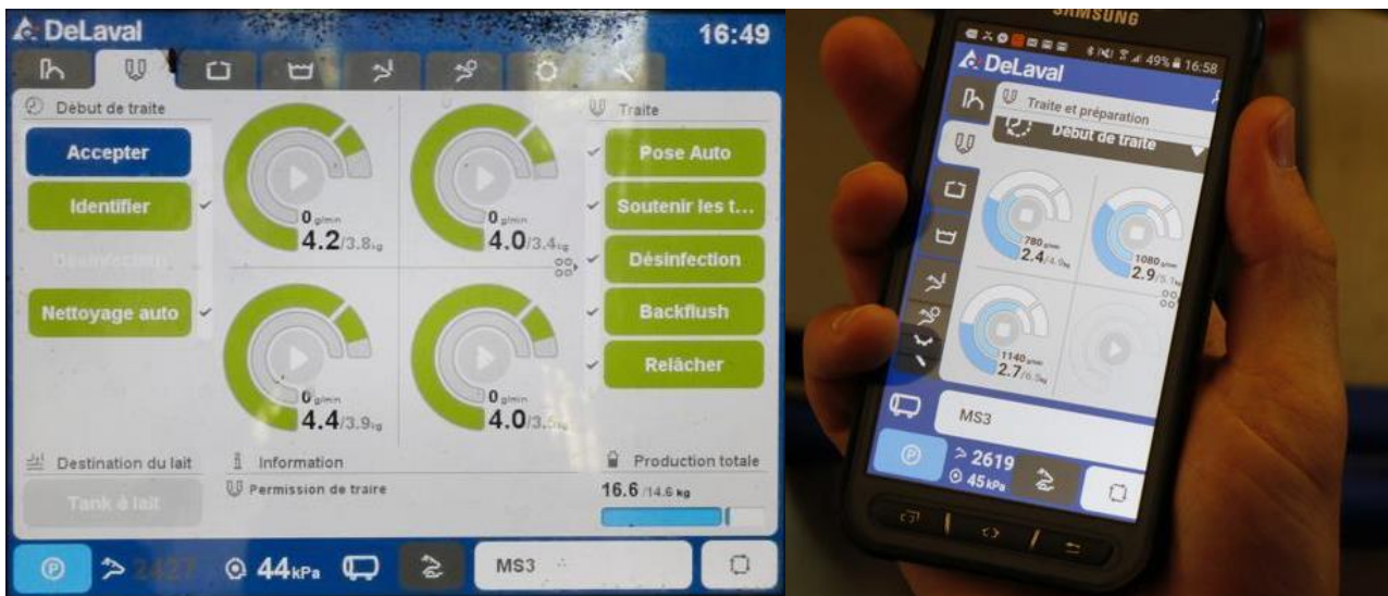
Figure 4 : Exemple de données transmises par le robot DeLaval VMS V300 sur ordinateur et smartphone

Le robot va donc essentiellement avoir un rôle de collecte et sauvegarde de la donnée, lorsque l'éleveur aura lui un rôle de traitement de la donnée et de prises de décisions.