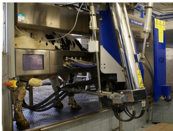
Figure 3 : L'ordinateur de bord du nouveau robot DeLaval VMS V300 (à gauche du bras robotisé)

Pour ce qui concerne l'interface d'accès aux données, elles sont disponibles sur le « Heard Navigator » qui est l'unité centrale du robot. Mais elles sont également disponibles en accès direct avec un PC, une tablette ou un smartphone à condition de posséder l'application/logiciel DeLaval et d'avoir le mot de passe, afin d'accéder aux informations. Néanmoins, la mémoire ne sera accessible que depuis un PC, puisque la mémoire du robot ne peut excéder 2 traites.