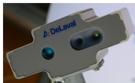
Figure 2 : Le nouveau capteur DeLaval, qui permet de calculer la NEC

Il serait bien évidemment trop long et inutiles de détailler tous les capteurs présents sur le robot laitier, c'est pourquoi nous détaillerons uniquement les processus dans lesquels les capteurs entrent en jeu.