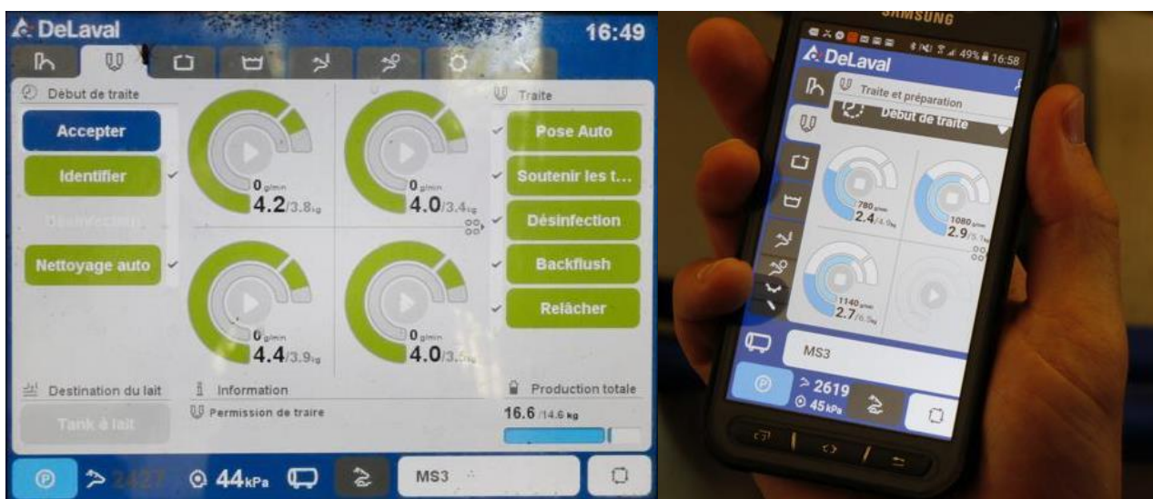
Figure 4 : Exemple de données transmises par le robot DeLaval VMS V300 sur ordinateur et smartphone

Le robot va donc essentiellement avoir un rôle de collecte et sauvegarde de la donnée, lorsque l'éleveur aura lui un rôle de traitement de la donnée et de prises de décisions.