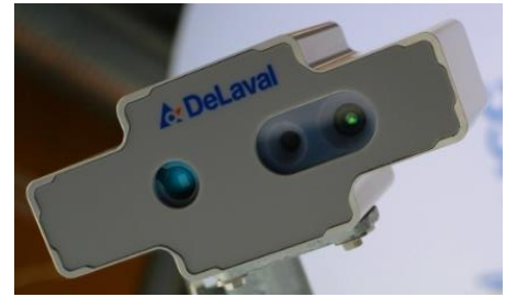
Figure 2 : Le nouveau capteur DeLaval, qui permet de calculer la NEC

Il serait bien évidemment trop long et inutiles de détailler tous les capteurs présents sur le robot laitier, c'est pourquoi nous détaillerons uniquement les processus dans lesquels les capteurs entrent en jeu.