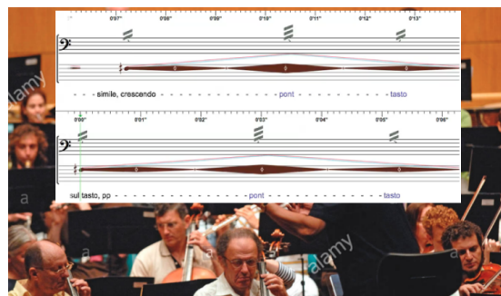
Figure 2. Représentation de la partition, du point de vue de l'interprète.

Selon les interprètes, 19 ces casques offrent un affichage large et confortable, car l'environnement est toujours visible autour de la partition (voir Figure 2), ou à travers la partition dans le cas d'un affichage holographique. 20 Les interprètes se sont également montrés intéressés par la possibilité de se déplacer librement sur scène ou ailleurs (ces pièces fut chorégraphiées différemment à chaque fois selon le lieu). Cet investissement physique des interprètes n'est pas sans rappeler le terme phygital (physique + numérique, attribué à Fabrizio Lamberti [30]), selon lequel les possibilités de physicalisation du jeu vidéo engloberont bientôt d'autres domaines des réalités augmentées et virtuelles.