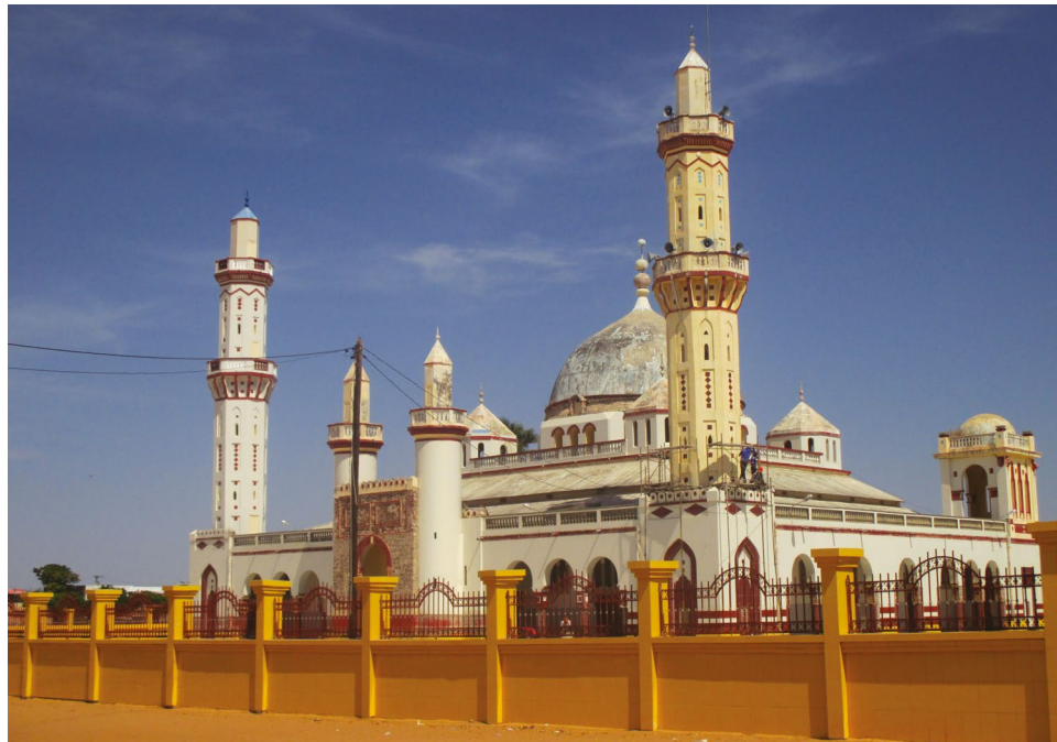
Mosquée de Diourbel, Sénégal, 2013. Muriel Sajoux

de Ouakam, nous faisons 40 % de social. Je ne peux pas passer de garde sans régler des cas. Des fois ils vous disent qu'ils n'ont pas d'argent. Je suis obligé de déboursier, d'aller négocier ou de me débrouiller. Je ne peux pas les laisser mourir ». Il apparaît à travers ces propos que l'aide gouvernementale aux personnes âgées reste très en deçà des besoins. Les prestataires de service dans les structures de santé se trouvent confrontés à des personnes âgées démunies qu'ils doivent traiter. De plus, en l'absence de professionnels pour accompagner les personnes âgées dans leurs parcours de soins, les familles sont obligées de s'impliquer comme en témoignent nos données d'observations.