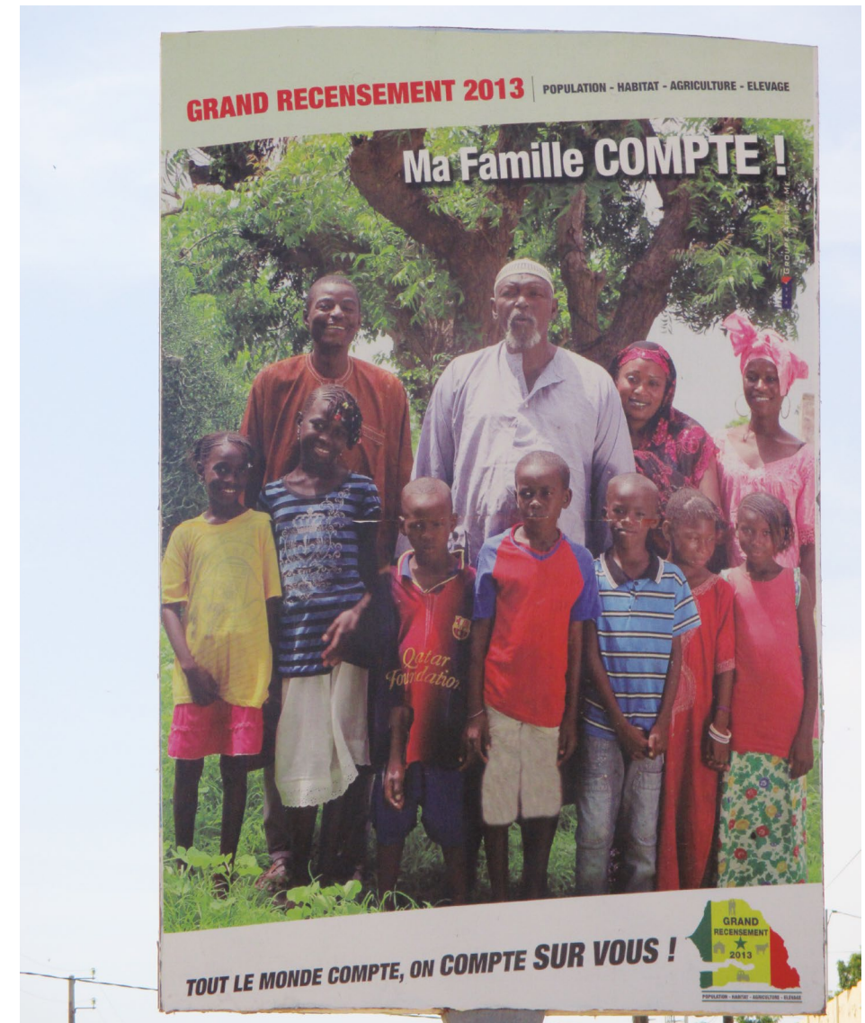
Diourbel, Sénégal, 2013. Muriel Sajoux

Comme cette dame, et contrairement aux idées reçues, certaines personnes âgées au Sénégal, vivent dans des situations de vulnérabilité et sont souvent seules, elles assistent impuissantes à la modification de leur statut et à la dépossesion de leur rôle social (Antoine, 2007). En effet, les migrations participent de plus en plus à la fragilisation du tissu social et à la solitude ou encore à l'isolement des personnes âgées. La proportion de personnes vivant seules est de 1,1 % pour les femmes âgées et de 1,4 % pour les hommes âgés (Antoine et Golaz, 2009). Ces chiffres s'expliquent par le veuvage mais aussi par les différentes formes de migration. De plus, il apparaît que la concentration dans la capitale des actions sanitaires et sociales dédiées aux personnes âgées rend problématique leur prise en charge dans les villes secondaires et en milieu rural très touché par les migrations internes et internationales.