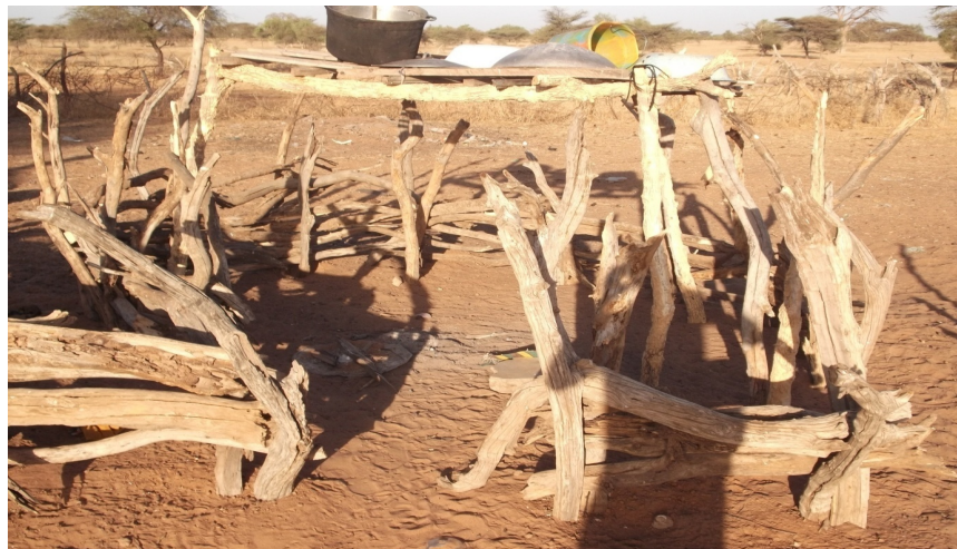
Photo 1 : Une cuisine peule dans un campement du Ferlo

Dans les campements, les ustensiles de cuisine sont rangés dans les cases. Précisons qu'aujourd'hui, toutes les cases ne sont plus faites uniquement de bois et de paille : certaines sont fabriquées en ciment et des toits en zinc sont apparus. Mais la forme initiale reste toujours la même. La cuisson des aliments est réservée aux femmes et est considérée comme une activité strictement féminine. Certains hommes refusent même de toucher les marmites parce que cela pourrait altérer l'efficacité des amulettes qu'ils portent sur eux 16 . La marmite, selon les personnes que nous avons interviewées, est