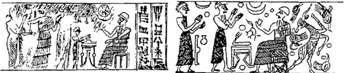
Fig. 2 : Empreintes de sceaux-cylindres avec représentation de tables, d'après Tessier 1994, n° 466 et 321.

Cette attestation de chaise ou tabouret est assez unique et il n'est pas certain que toutes les maisons en étaient pourvues, il est plus vraisemblable que les gens s'asseyaient à même le sol, sur des empilements de tapis et couvertures, ou encore sur des banquettes fixes en argile. En revanche, les tables paššurum sont régulièrement mentionnées 40 ; nous n'avons quasiment aucune indication sur leur forme, qu'il s'agisse de tables avec pieds ou de simples plateaux. Toutefois, un marchand réclame par lettre à un collègue « un plateau de table de 1 ½ coudée », soit 75 cm, précisant qu'il dispose de pieds 41 . Cette dimension semble être assez standard car elle documentée par un autre texte 42 . Les représentations de tables sur les sceaux-cylindres, bien qu'il s'agisse de tables cultuelles, donnent une idée de la forme générale de ces meubles.