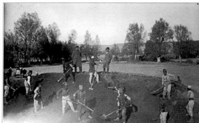
Fig. 2 et 3 : entassement des pierres du palais et tranchée dans la citadelle, fouilles de B. Hrozný en 1925. D'après le catalogue de l'exposition : From Boğazköy to Karatepe, Istanbul, 2001 :96 et Özgüç 1999 : pl. 3.