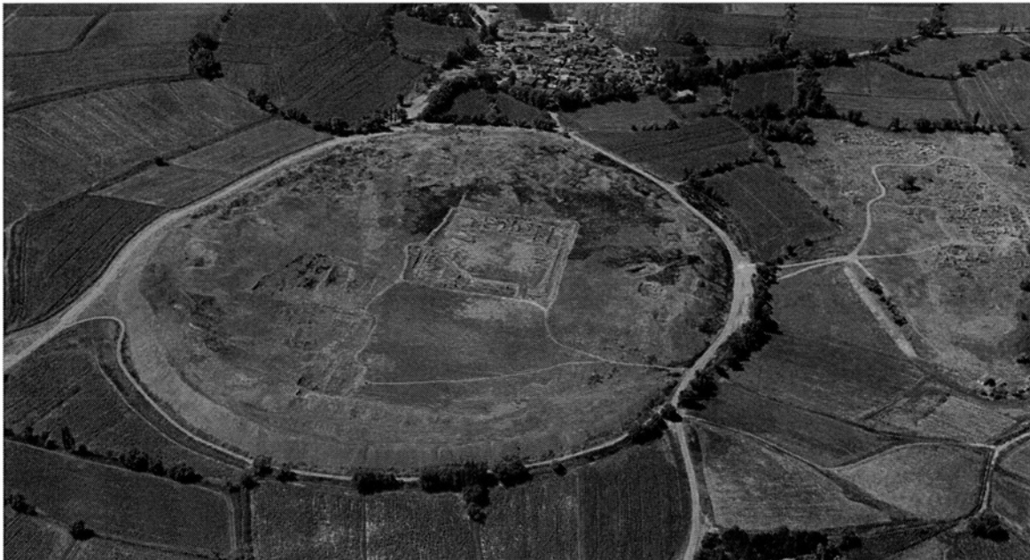
Fig. 1 : Vue aérienne de Kültepe avec la citadelle et la ville basse.

Une rapide synthèse des principaux secteurs des palais des niveaux 8 ( kārum II) et 7 ( kārum Ib) à partir des travaux de T. Özgüç vise à faire le point sur les données archéologiques disponibles sur ces bâtiments. L'analyse des informations proposées par la quarantaine de tablettes exhumées sur la citadelle et par les archives des marchands de la ville basse montre comment le palais, en tant qu'organisme politique, incarne le pouvoir. L'inventaire des fonctionnaires anatoliens mentionnés dans les textes offre des informations sur l'organisation du pouvoir dans cet organisme 1 .