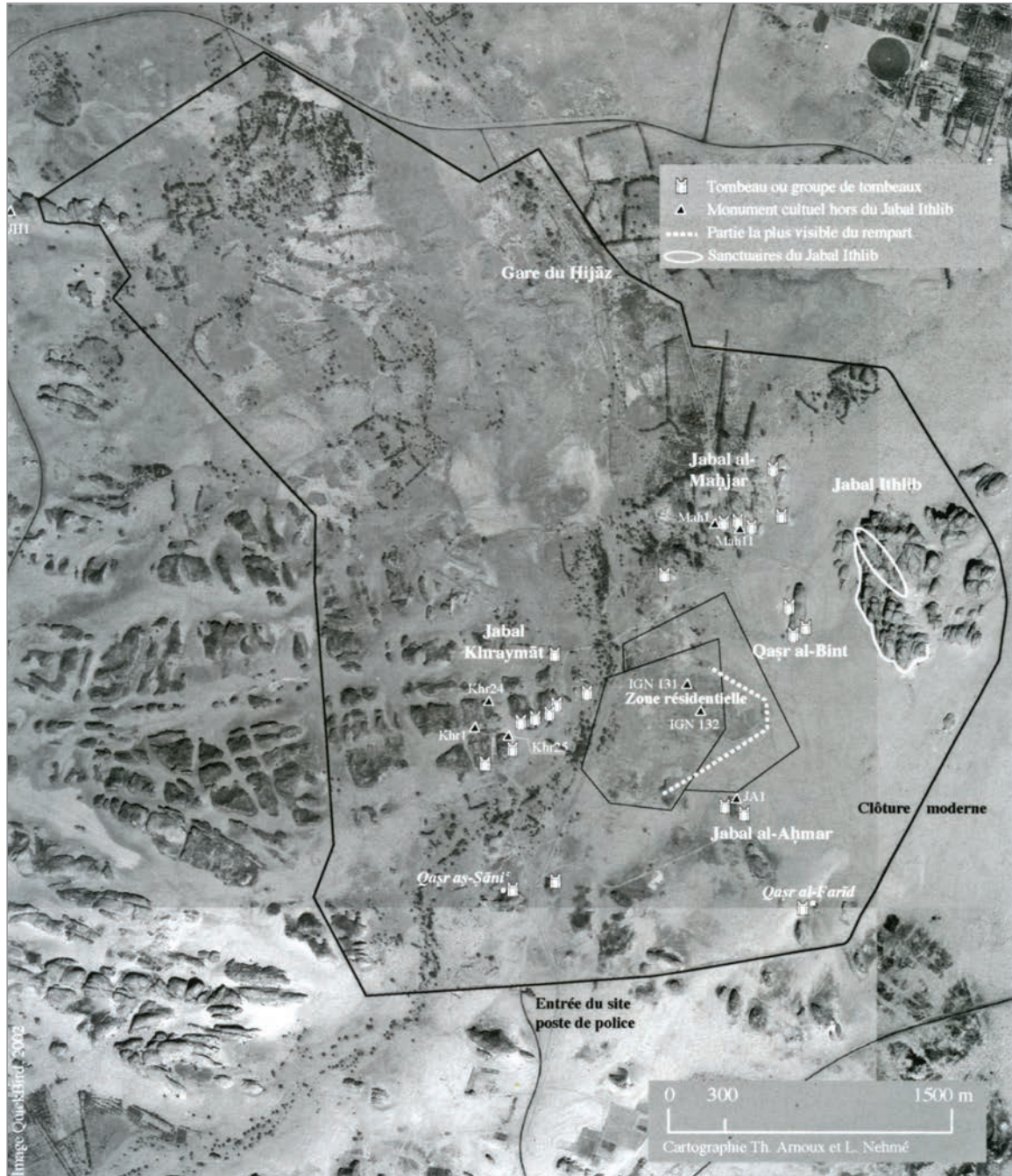
Fig. 3 : Site de Madâ'in Sâlih (Nehmé et al. 2006)