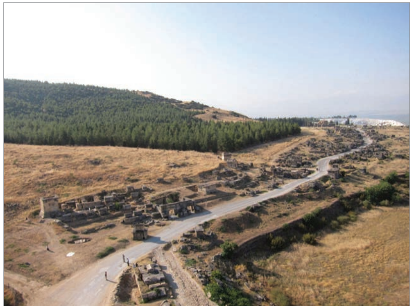
Fig. 2 : Vue depuis le Nord-Ouest de la nécropole nord de Hiérapolis.

La plupart des tombes de la nécropole est sont