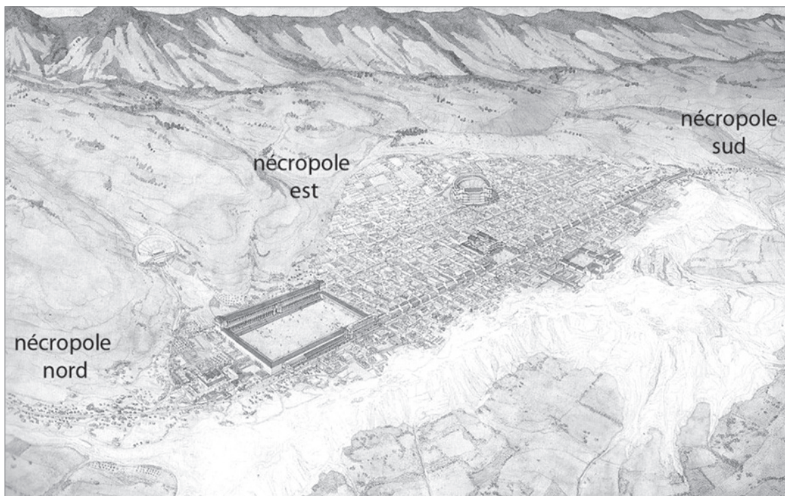
Fig. 1 : Organisation urbaine de Hiérapolis, vue depuis le Nord-Ouest (Golvin 2005, p. 80-81.) Localisation des nécropoles d'après l'auteur.

aménagements autour et à l'intérieur des tombes se posent, notamment dans le but d'appréhender les gestes et pratiques funéraires des groupes qui ont inhumé leurs proches dans ces ensembles funéraires. Deux