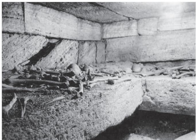
Fig. 5 : vue de l'intérieur de la chambre inférieure avant la première campagne de fouilles (Ronchetta, Mighetto 2007 n°7 p. 440).