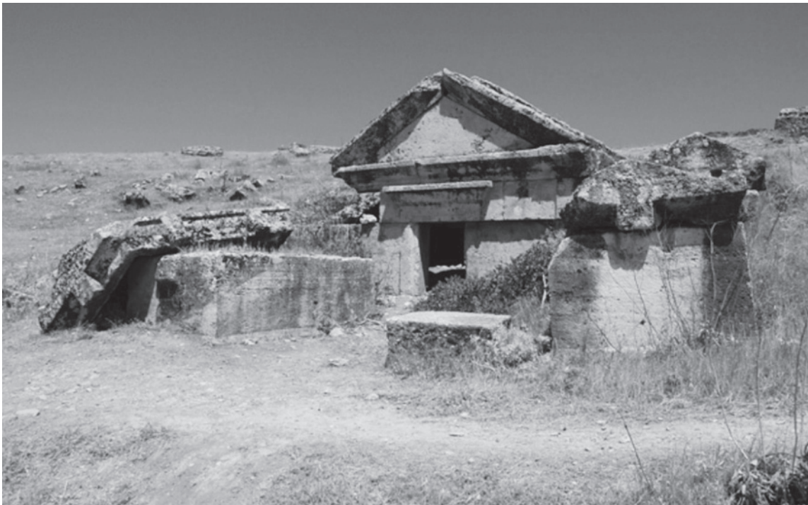
Fig. 6 : vue depuis l'ouest de la tombe C92 encadrée de trois sarcophages (projet Thanatos).

Le second exemple que nous présenterons ici correspond à la tombe C92, qui se trouve sur les hauteurs de la nécropole est. Elle appartient elle aussi à un complexe de tombes ; trois sarcophages se répartissent en effet autour de cette chambre funéraire (fig. 6). Alignée avec la chambre funéraire C92a, elle est faite de larges blocs de travertin et mesure environ 3x3m. Son toit est aussi en double pente. À l'intérieur, trois banquettes sont ancrées dans les murs et sur le mur du fond, une seconde banquette est insérée en hauteur.