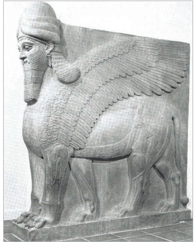
Fig. 4 : : Lamassu, palais nord-ouest de Kalḫu (d'après Bahrani, 2003 : fig. 21)

Le corps est finalement conçu comme une enveloppe de l'être, et peut tout aussi bien être un corps de chair qu'un corps de matière inerte (pierre par exemple). Cette place centrale du corps, dans la phénoménologie comme dans l'ontologie mésopotamienne, a conduit Merleau-Ponty à s'interroger sur les conditions de sa liberté, et c'est un questionnement qu'il importe de reprendre ici. Merleau-Ponty estime que le corps est absolument libre puisque rien ne le contraint du dehors, qu'il est tout son extérieur 78 . S'il y a une liberté du