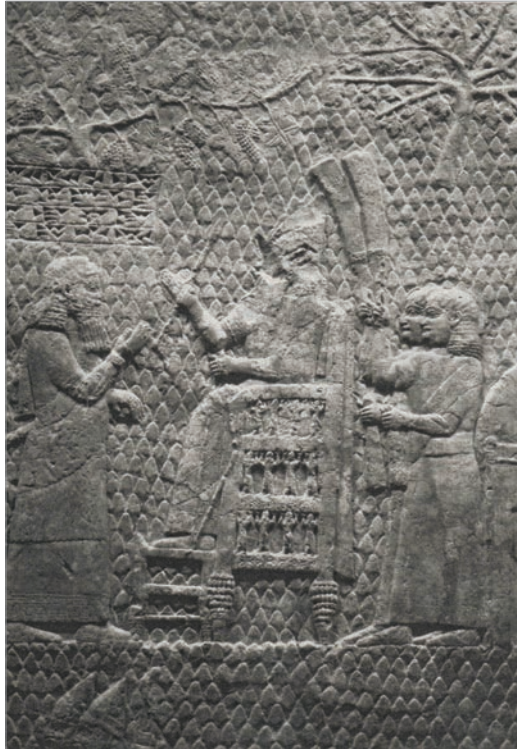
Fig. 2 : Palais sud-ouest, Salle XXXVI, dalle 13 : visage de Sennachérib martelé (d'après Bahrani, 2003 : fig. 11).

Une telle conception de l'image modifie son statut ontologique. Le refus systématique de tout procédé illusionniste dans l'art laisse penser que l'image n'était pas conçue comme la représentation spéculaire d'un objet, mais qu'au contraire tous les codes iconographiques employés visaient à en créer un second, une répétition de la chose, en se dégageant de l'imitation servile. Cette hypothèse se trouve soutenue par l'analyse que fait Z. Bahrani du terme šalmu dans The Graven Image . I. Winter a d'abord reconnu que šalmu en tant que représentation d'une personne ne pouvait être un portrait 58 , ce que le caractère idéalisé des représentations du roi laisse amplement deviner. Aucune en effet ne cherche clairement à matérialiser des traits individuels. Lorsqu'il sera possible d'isoler les traits caractéristiques d'un profil, l'historien d'art devra