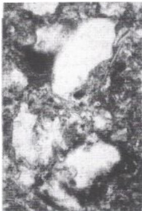
Fig.3: Melrand. revêtement argileux très poussiéreux remplissant la porosité naturelle du remplissage et indice d'une mise à nu du fossé. Lumière Naturelle, lcm = 0,03mm.

Fig.2: Le Boisanne, fragment de l'horizon pédologique argileux (Bt) remanié et piégé dans un fossé. Il témoigne d'une érosion active ayant déjà attaqué les horizons superficiels environnants. Lumière Naturelle, lcm=0,25mm.