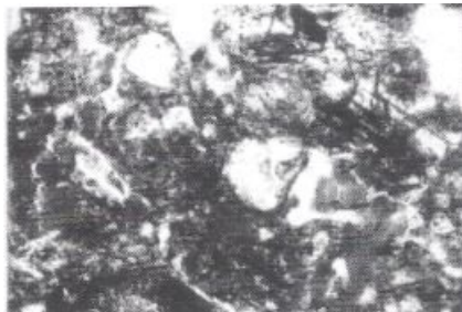
Fig.4: Melrand, fragments d'horizon Bt remanié et piégé dans un fossé. Lumière Naturelle, lcm= 0.25mm