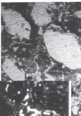
Fig.5: Les Sept Perthuis, les revêtements argileux limpides (L) et poussiéreux (P) remplissent la même porosité du sédiment de remplissage du fossé. Ils révèlent une alternance de reconquête végétale et de désherbage du fossé. Lumière Naturelle, lcm = 0,25mm.