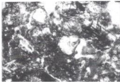
Fig.3: Melrand. revêtement argileux très poussiéreux remplissant la porosité naturelle du remplissage et indice d'une mise à nu du fossé. Lumière Naturelle, lcm = 0,03mm.