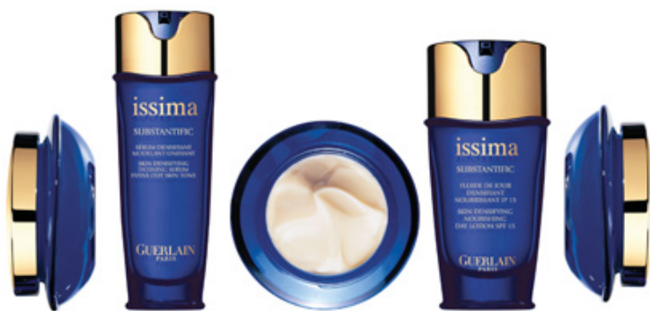
Figure 5 - Substantific.

concentrée d'acides gras insaturés, issue d'algues de la famille des chrysophycées. Des études par diffraction des rayons X ont montré que l'or bleu s'intègre au ciment lipidique intercornéocytaire pour le renforcer [17].