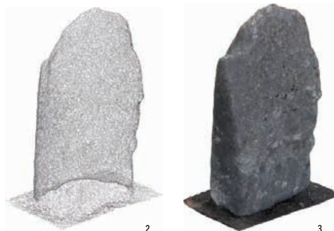
Exemple de levé photogrammétrique sur une statue menhir. 1. Acquisition photographique. 2. Nuage de points. 3. Modèle maillé et texturé.