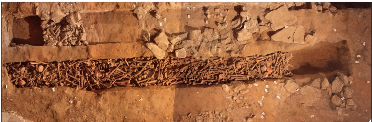
Fig. 2. Ossuaire n° 3 de la nef souterraine, assemblage de vues zénithales (clichés : Y. Créteur, Inrap).