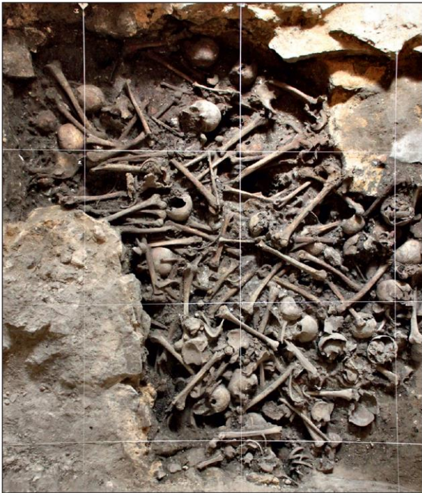
Fig. 4. Ossuaire n° 5, vue zénithale.