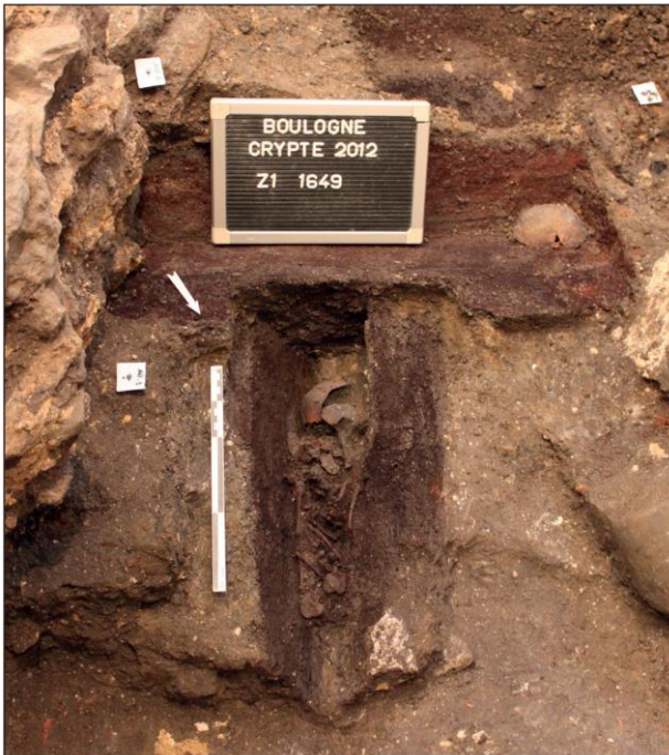
Fig. 8. Ossuaire n° 5, individu immature inhumé en cercueil.