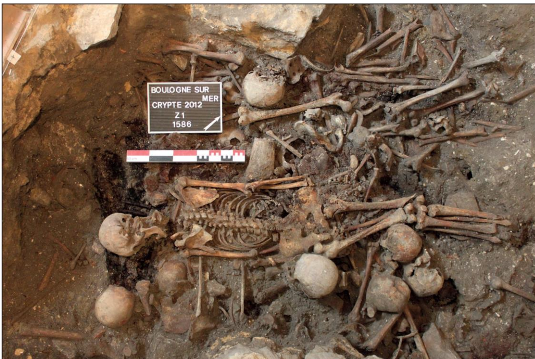
Fig. 6. Ossuaire n° 5, individu adulte inhumé sur le ventre.