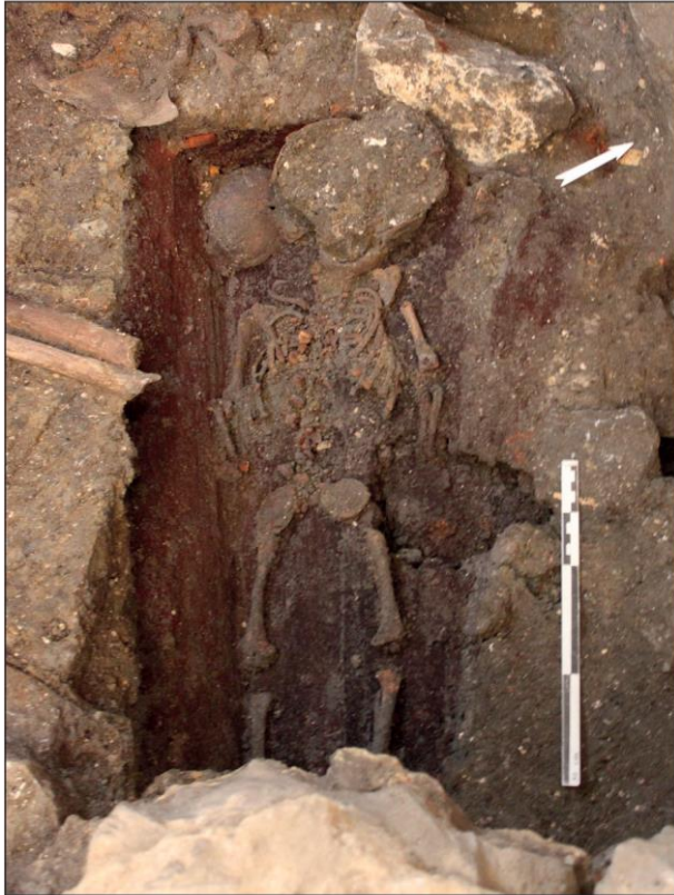
Fig. 7. Ossuaire n° 5, individu immature inhumé en cercueil.