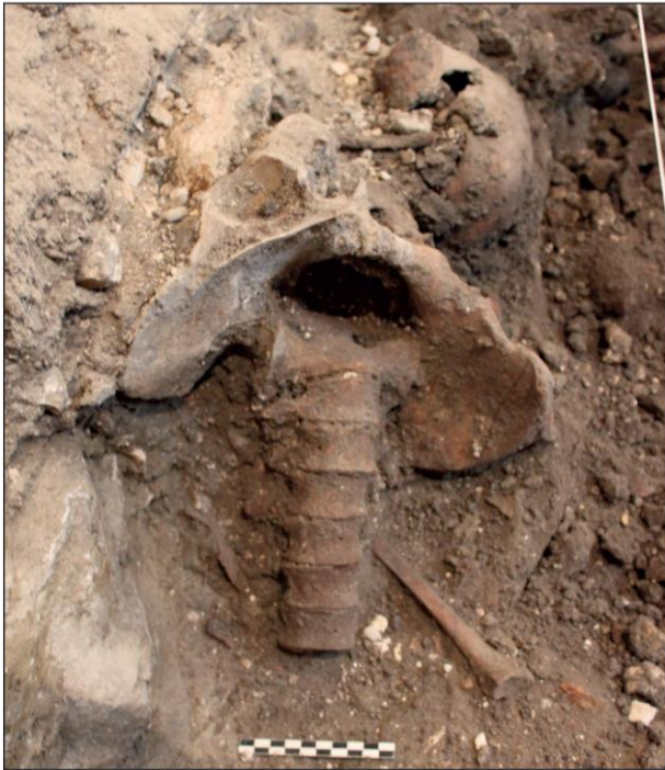
Fig. 5. Ossuaire n° 5, exemple de connexion anatomique conservée.