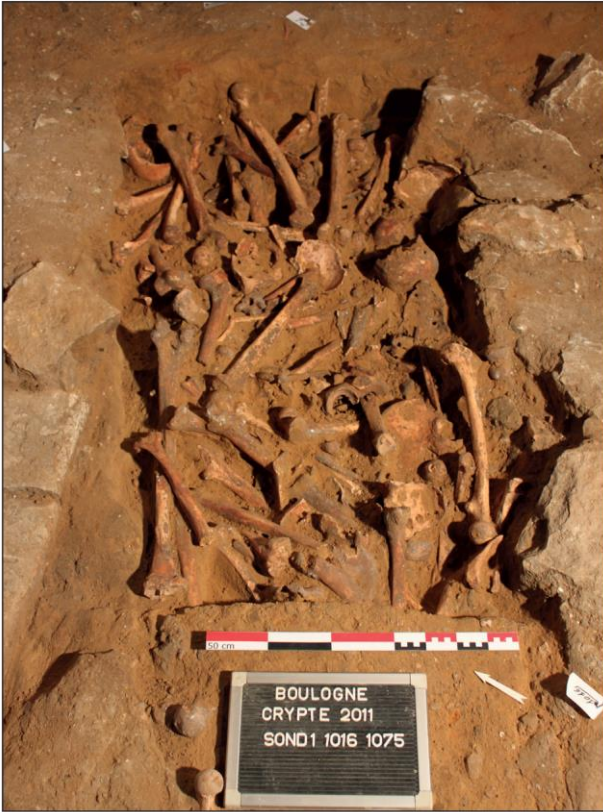
Fig. 3. Sondage manuel dans l'ossuaire n° 3 de la nef souterraine.