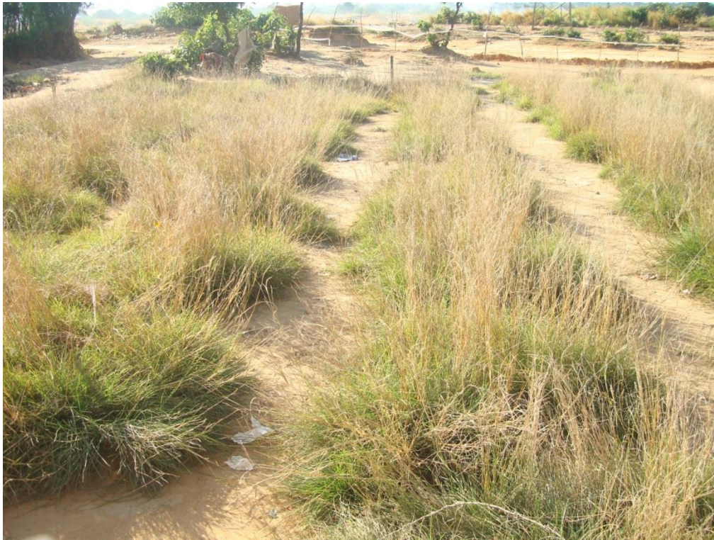
Figure 2 Dispositif expérimental in situ de trois ans d'un essai de phytostabilisation de sols contaminés par les poussières d'une fonderie de cuivre. 16 pieds de Microchloa altera ont été plantés par m 2 en 2009 sur le site Penga-Penga contaminé en Cu situé à proximité de la cheminée de la fonderie de la Gécamine à Lubumbashi (Rép. Dém. Congo)