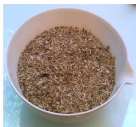
Récolte et traitement de la biomasse aérienne