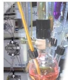
Ecocatalyse pour la synthèse organique