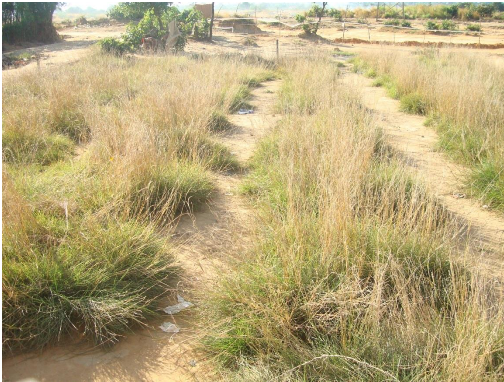
Figure 2 Dispositif expérimental in situ de trois ans d'un essai de phytostabilisation de sols contaminés par les poussières d'une fonderie de cuivre. 16 pieds de Microchloa altera ont été plantés par m 2 en 2009 sur le site Penga-Penga contaminé en Cu situé à proximité de la cheminée de la fonderie de la Gécamine à Lubumbashi (Rép. Dém. Congo)