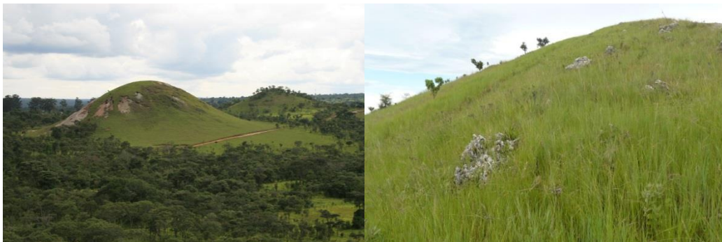
Figure 1 Vue générale d'un affleurement de roches de Cu et Co (à gauche) et savane steppique de pente (à droite).

Les sols enrichis naturellement en métaux lourds représentent des habitats très contraignants pour la végétation. Des affleurements naturels de roches très riches en cuivre et cobalt sont exceptionnels à la surface de la Terre et constituent des anomalies géochimiques (Pourret et al., in press). La colonisation de tels affleurements par des communautés végétales adaptées, diversifiées et riches en espèces, est une singularité biogéographique et écologique du Katanga (Duvigneaud & Denaeyer-De Smet 1963 ; Brooks & Malaisse, 1985). Ces affleurements se présentent sous forme de collines portant une végétation herbacée dispersée dans la forêt claire. La flore de ces habitats primaires naturellement riches en Cu est composée d'environ 600 espèces dont 32 espèces endémiques strictes (Faucon et al., 2010).