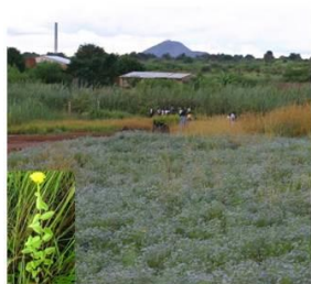
Phytoextraction sur sols contaminés par le cuivre et cobalt