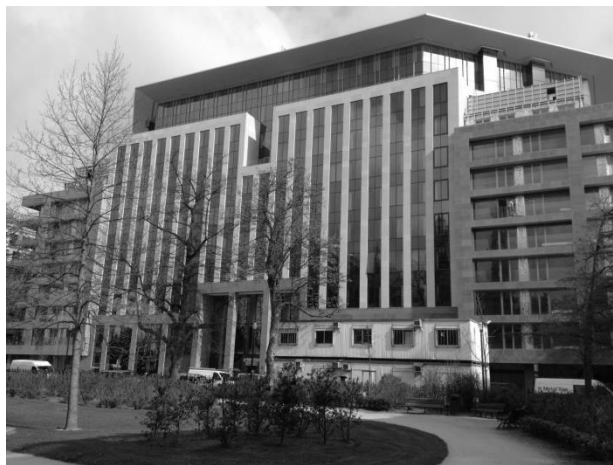
Figure 3 : Le New Urban, première construction de bureaux sur l'îlot F – architectes : Atelier d'Architecture du Sart Tilman (AAST) et Centre d'Études et de Recherches d'Architecture et d'Urbanisme (CERAU) – Maître d'ouvrage : AG Real Estate

En réalité, la silhouette du bâtiment est très éloignée dans ses formes de celles projetées par le projet urbain. La massivité de la construction ne libère aucun espace au sol le long de l'alignement, la longueur de façade aggravant encore cette massivité. Le cœur d'îlot est inaccessible et on est donc loin de l'îlot ouvert, mais il est vrai que le permis de cette construction a été délivré avant l'élaboration du RRUZ.