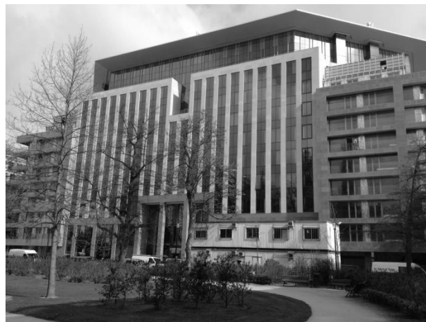
Figure 3 : Le New Urban, première construction de bureaux sur l'îlot F – architectes : Atelier d'Architecture du Sart Tilman (AAST) et Centre d'Études et de Recherches d'Architecture et d'Urbanisme (CERAU) – Maître d'ouvrage : AG Real Estate – Photo : P. Thiard

En réalité, la silhouette du bâtiment est très éloignée dans ses formes de celles projetées par le projet urbain. La massivité de la construction ne libère aucun espace au sol le long de l'alignement, la longueur de façade aggravant encore cette massivité. Le cœur d'îlot est inaccessible et on est donc loin de l'îlot ouvert, mais il est vrai que le permis de cette construction a été délivré avant l'élaboration du RRUZ.