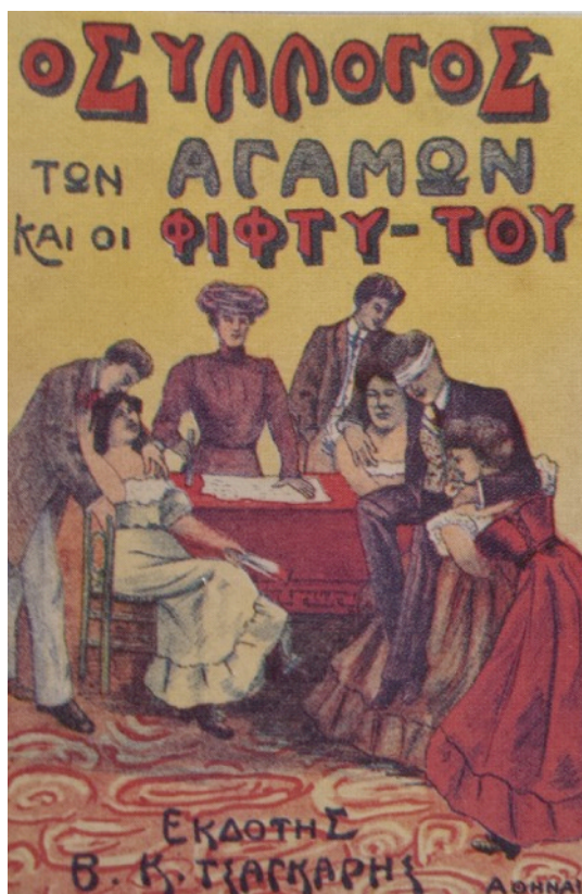
Le Club des Célibataires et les fifty-two , 193 livraisons, Athènes : Tsángaris, 1909. La couverture représente un rite d'initiation pratiqué par le club de célibataires : tout nouveau membre doit être porté devant la présidente du club yeux bandés et sur les mains de deux jeunes filles.

Publié anonymement en 1909 chez le libraire athénien Tsángaris en 193 livraisons, Le Club des célibataires et les fifty-two qui intéresse le présent article s'insère naturellement dans cet ensemble de fictions d'actualité signées par l'auteur. Malgré les défauts évidents d'une composition qui multiplie les intrigues sans les lier ni souvent les achever, ce roman est un cas exemplaire, sinon unique, d'une fiction qui ne cesse d'exhiber ses rapports avec le journal. Dès les premières pages le roman se présente en quelque sorte comme une véritable « rhapsodie médiatique » qui met bout à bout de nombreux extraits d'articles journalistiques. C'est un roman qui tente de capitaliser, comme son titre l'indique, sur deux faits divers à succès relativement récents à l'époque de sa publication.