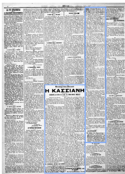
Entouré en bleu, le premier feuilleton de Cassienne dans Khrónos (p. 2), le 1 er avril 1905.

Son premier grand succès, Cassienne publié en 1905, est par exemple un roman historique qui raconte la vie mouvementée de la sainte éponyme ayant vécu au IX e siècle. Tout en soulignant la fidélité de cette fiction à l'histoire, l'annonce de sa parution prochaine en feuilleton dans le quotidien Khrónos insiste prioritairement sur son rapport au présent : « C'est la lecture d'actualité par excellence en vue des jours saints à venir 6 ». Tandis que les Grecs s'apprentent à fêter la semaine sainte, le roman promet ainsi de leur livrer tous les détails des péripéties mystérieuses qui ont fait de Cassienne, jadis grande pécheresse, l'auteure d'un hymne touchant chanté lors de la liturgie orthodoxe du mardi saint. Le feuilleton connaît un succès inespéré et sa popularité peut aisément se mesurer à la fois au grand nombre de ses rééditions grecques mais aussi étrangères, notamment à Constantinople, Alexandrie, Le Caire, New York et Chicago.