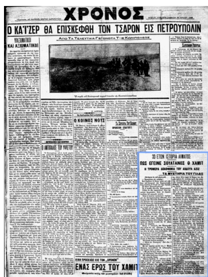
Khrónos , 25 avril 1909. Entouré en bleu : « 33 ans de règne sanguinaire. Comment Hamit est devenu Sultan. Les terribles meurtres d'Abdülaziz. Les Mystères de Yildiz ».

Tout en racontant le règne du sultan sanguinaire qui venait d'être destitué par les Jeunes-Turcs, Kiriakós n'épargne pas pour autant ses successeurs et commente dans sa fiction des événements d'une actualité brûlante comme l'assassinat de Hasan Fehmi, rédacteur en chef du journal turc Serbesti ou encore les débats houleux de la chambre ottomane concernant les massacres d'Adana.