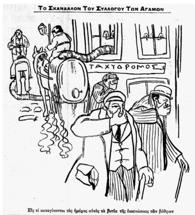
Caricature en une de Khrónos , le 28 février 1908. Sont représentés ici les bureaux du journal Takhidromos , avec la légende : « Voilà à quoi s'affairent en ce moment les vidangeurs de fosses septiques ».

Certains quotidiens comme Skrip et Khrónos dont Kiriakós avait quitté la rédaction pour fonder son propre journal se montrent particulièrement virulents. Khrónos notamment n'hésite pas à verser dans la scatologie pour décrire les agissements honteux d'une feuille « populaire » dont la circulation se limiterait aux seuls quartiers ouvriers et prête à tout pour augmenter ses tirages. Rebaptisé par un jeu de mots « Takhivrómos » (c'est-à-dire Tas-quipue) et caricaturé à plusieurs reprises, le journal de Kiriakós subit de plein fouet l'ironie de son concurrent Khrónos . Celui-ci fait même semblant de déplorer en une fin d'article le fait que Takhidrómos , désormais déconsidéré par ses affabulations, allait perdre son lieu de diffusion privilégié : les toilettes publiques 15 .