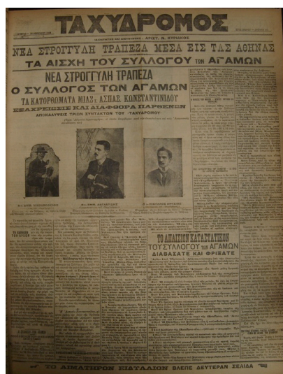
Takhidrómós , 23 février 1908.

Le retour dans l'actualité du « club des célibataires » intervient le 23 février 1908 en une de Takhidrómós . La tribune ainsi que l'article qui font mention d'une « Nouvelle table ronde à Athènes » laissent d'emblée transparaître la volonté de sensationnaliser la nouvelle par la mention d'un intertexte médiatique prestigieux. La rédaction fait le choix d'inscrire le fait divers athénien dans une sérialité internationale de scandales de mœurs et même de l'assimiler à un scandale politique allemand toujours actif dans les imaginaires européens. La mention de la « table ronde » renvoie à l'affaire Eulenburg qui durera plus de trois ans et qui éclate en 1906 après les révélations du journaliste Maximilian Harden dans le journal