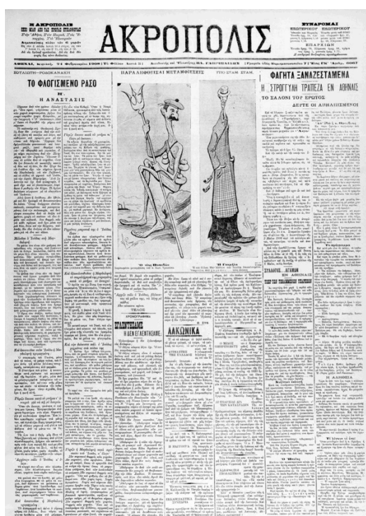
Akrópolis , 24 février 1908.

L'existence de ces deux sociétés secrètes qui ont chacune leurs propres codes et signes distinctifs a été dévoilée pour la première fois dans les colonnes d'un quotidien respecté pour la qualité et la fiabilité de ses informations. Il s'agit d' Akrópolis , un titre phare dans l'histoire de la presse grecque qui a notamment introduit les pratiques de l'interview et du reportage dans les pratiques journalistiques 8 . Le traitement choisi par les journalistes pour présenter ces deux cercles est satirique.