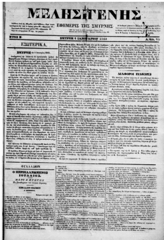
Le Juif Errant d'E. Sue dans le feuilleton du journal smyrniote Melisiyenis en 1845.

Mais la reprise d'une simple pratique de publication n'engage en rien nécessairement des mutations plus profondes qui sont de l'ordre des poétiques textuelles. Il faudra en effet attendre, pour que se mettent en place les conditions d'une véritable interaction entre discours journalistiques et littéraires, la date charnière de 1873 avec la création à Athènes d' Ephimeris , le premier quotidien grec 2 .