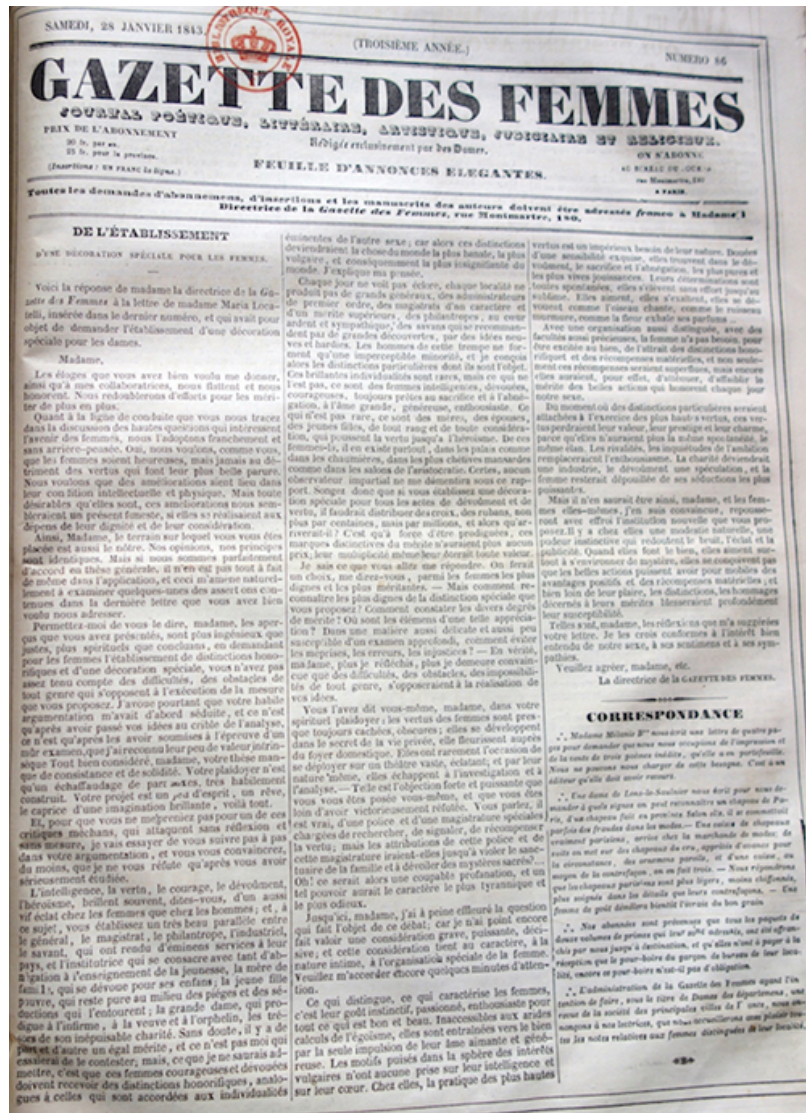
III. 3 : Gazette des femmes , 28 janvier 1843.

Grand Opéra 18 , roman cosigné par « Léo Lespès » et la « Marquise de Vieuxbois », auteurs dont l'identité véritable est problématique 19 .