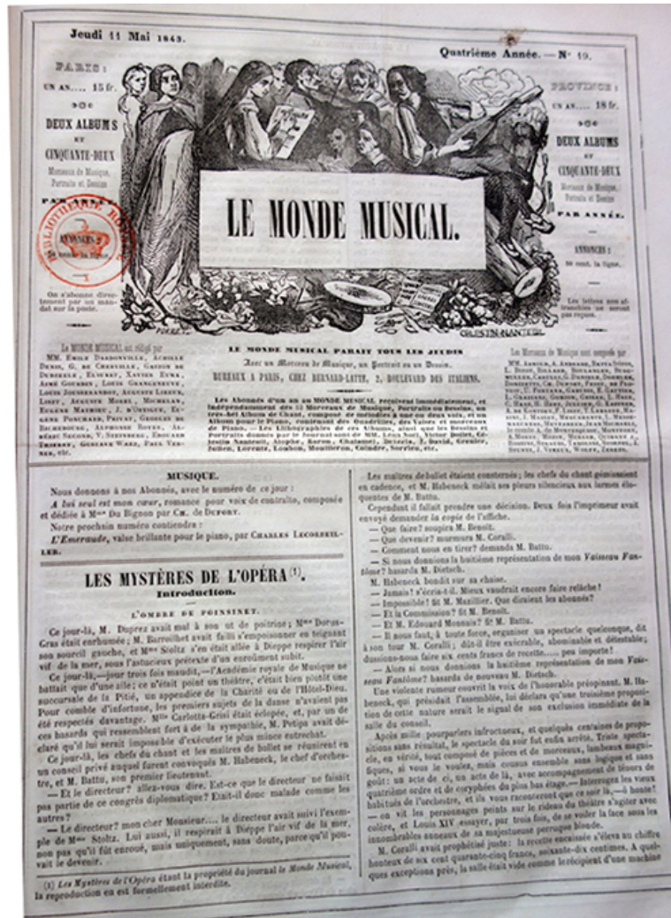
III. 4 : Le Monde musical , 11 mai 1843.

Quelques mois plus tard, Le Monde musical , hebdomadaire spécialisé paraissant tous les jeudis et dont les bureaux sont installés à deux pas de l'Académie royale de musique, s'engage dans la même voie. Constatant que « depuis la publication des Mystères de Paris de M. Eug. Sue, la mode est aux Mystères 20 », le périodique annonce la parution prochaine, à partir du 11 mai 1843, des Mystères de l'Opéra 21 par Albéric Second.