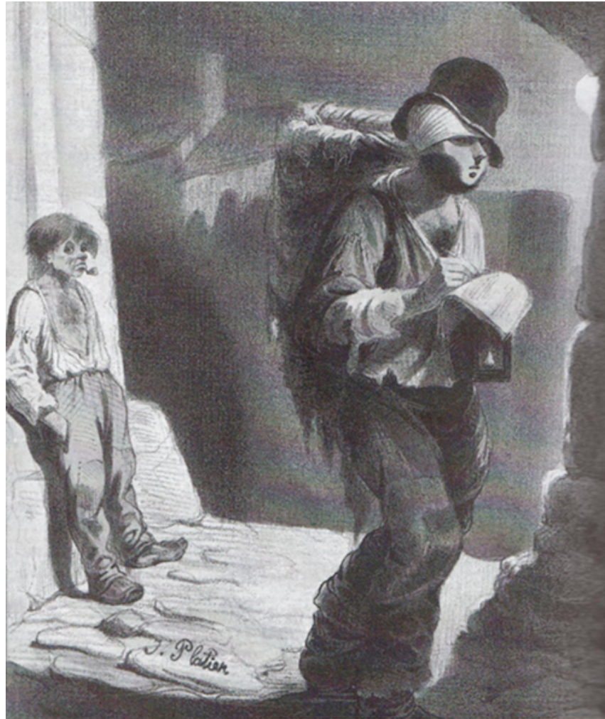
III. 2 : « Un littérateur distingué, en costume de travail, à la recherche des Mystères de Paris », dans Jacques Placier, « Un travestissement littéraire », La Caricature , 20 novembre 1842.

L'ascendant que prend ce dispositif énonciatif médiatique sur l'intrigue mélodramatique dans la réception des Mystères de Paris , entraîne un élargissement de l'aire d'influence du mystère urbain vers d'autres genres textuels à thématiques et poétiques radicalement différentes : le roman historique, le roman de mœurs, le pamphlet, la satire, le guide touristique, les enquêtes, toute la production imprimée, dans les années 1840, se trouve inmanquablement touchée par cette posture « mystériographique » qui se place désormais au centre de toutes les poétiques textuelles.