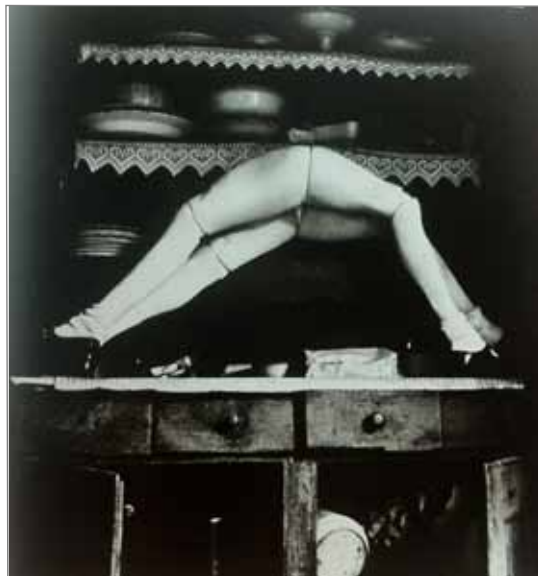
Fig. 5 : Hans Bellmer, La Poupée , 1935. (Reproduite avec l'aimable autorisation des ayants droits)