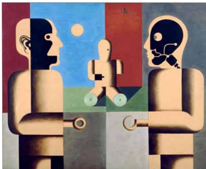
Fig. 1 : Heinrich Hoerle, Denkmal der unbekanntenen Prothesen (Monument à la prothèse inconnue), 1930. Huile sur papier, 70 x 85 cm. Von der Heydt-Museum, Wuppertal (image dans le domaine public)