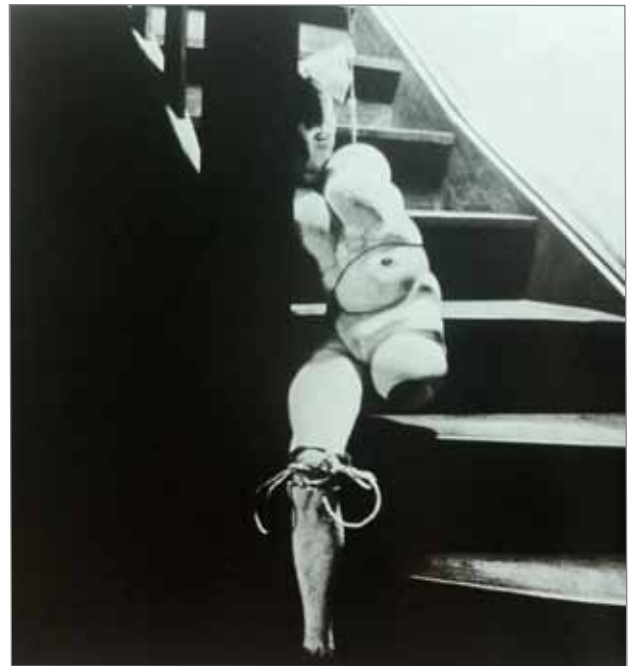
Fig. 6 : Hans Bellmer, La Poupée , tirage argentique 6 x 6 cm, 1935

d'un tel motif sera récurrent dans l'œuvre de Bellmer, car non seulement il implique une montée et une descente de l'escalier 18 avec un clin d'œil à Marcel Duchamp, mais il constitue une métaphore de la psyché avec inconscient et conscience à des étages différents. La Poupée 19 appartient à l'inanimé par son essence, mais appartient aussi à l'animé par la manière dont Hans Bellmer la met en scène et la contextualise. Bellmer construit un territoire pour sa poupée. Ce territoire est familier et comprend systématiquement un passage. L'escalier ou la porte sont présents car ils sont des éléments qui indiquent une prolongation du champ sans pour autant qu'on puisse l'apercevoir dans son intégralité. Le lieu est résumé, suggéré, on ne le distingue pas dans son entier. L'espace est donc toujours partiel, il implique l'existence d'une succursale qui est une métaphore de l'inconscient. L'escalier mène quelque part au-delà de l'image et prend son origine au-delà de celle-ci. La Poupée a pu emprunter cet escalier ou cette porte, elle peut se mouvoir au sens métaphorique