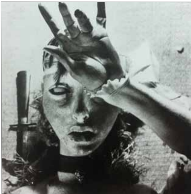
Fig. 3 : Hans Bellmer, La Poupée , négatif 6 x 6 cm, tirage argentique, 1935.

vivant n'aurait pas par hasard une âme" 12 ». Le sentiment d'inquiétante étrangeté est généré par quelque chose d'indéterminé, de non reconnaissable, qui surgit dans le familier, dans la maison. Dans ce lieu que l'on connaît pour l'avoir fréquenté de nombreuses fois, un élément, un je ne sais quoi d'imperceptible est là, à la frontière du vivant et du non vivant comme une présence indéfinissable. Cette situation crée littéralement une violence et le champ de perception est tout entier sur le qui-vive. Freud admet donc que le sentiment d'inquiétante étrangeté est produit par quelque chose qui se trouve là où il ne doit pas, où il ne doit plus. La Poupée photographiée 13 (1935) a le plus souvent un regard intentionnel qui lui confère la particularité de se situer à la frontière du vivant et du non vivant (fig. 3). Si l'objet semble regarder, c'est que l'observateur peut être vu. Une relation s'établit immédiatement entre l'objet photographié et le regardeur qui induit un malaise, un Unheimliche .