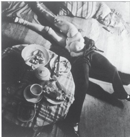
Fig. 4 : Hans Bellmer, La Poupée , 1935.

L'environnement de la Poupée est toutefois déterminant dans la production de cet affect. Le paysage forestier ou l'intérieur de la chambre, l'escalier ou la remise, sont des lieux qui sont choisis par Hans Bellmer pour contextualiser la Poupée . Il y aura toujours un paysage que nous qualifions d'intime chez Bellmer, car c'est dans l'intimité que le sentiment d'étrangeté apparaît. Rien de plus banal en effet que le lit défait, la table non débarrassée 14 (fig. 4), le buffet encombré 15 (fig. 5). La forêt et la chambre sont des lieux communs que tout amateur reconnaît comme son propre lieu. Lorsque la Poupée est fragmentée, que ses membres absents ou