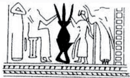
Fig. 4 – Déroulement de cylindre protodynastique, GMA 1194, Ur.

On trouve effectivement des scènes de banquet qui ne posent aucun problème d'interprétation du moins au niveau formel : deux personnages en vis-à-vis, souvent un homme et une femme (ce qui déjà permet de conclure que les femmes -