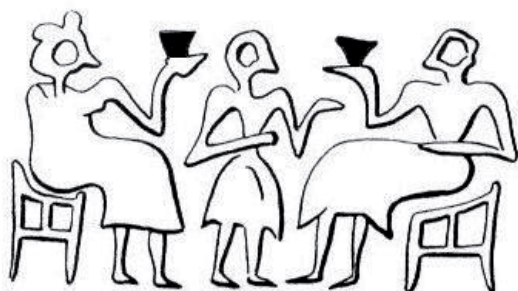
Fig. 3 – Déroulement de cylindre protodynastique, GMA 1167, scène de banquet avec gobelet.

existe effectivement des fêtes qui ponctuent la vie sociale dans toutes les sociétés, partout dans le monde, et que rien n'est là très original 7 . Mais surtout, cet ouvrage regroupe des scènes fort diverses, comme d'ailleurs tous les ouvrages qui traitent de la reconnaissance des scènes et qui tentent de les interpréter sans méthode préalable. Le seul élément qui, à la lecture et à la réflexion, semble pris en compte est la position en vis-à-vis des personnages, c'est-à-dire un arrangement formel. Malheureusement, les variantes sont trop nombreuses pour qu'on puisse se satisfaire de ce seul paramètre.