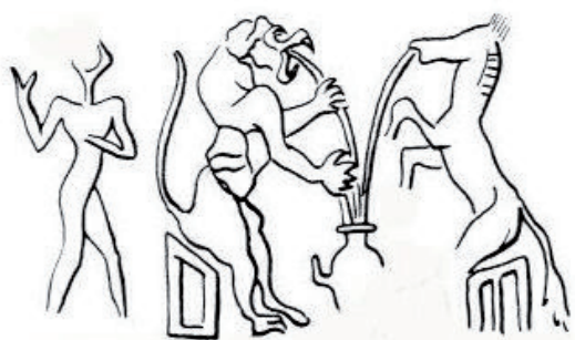
Fig. 1 – Déroulement de cylindre akkadien, GMA 1313, Tell Asmar.

mêmes 3 , soit de longues tiges creuses et coudées à angle droit, exceptionnellement retrouvées dans des petites jarres 4 . L'association des uns avec les autres n'est pas attestée. L'usage documentaire de l'iconographie est nettement plus problématique.