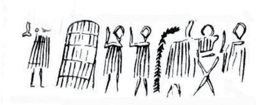
Fig. 7 – Déroulement de cylindre protodynastique, GMA 1455, s.l.

objets antiques (trône de Verruchio, tintinnabulo de Bologne, lécythe du tissage attribué au Peintre d'Amasis). Elle est aussi bien connue dans nos campagnes sous le nom d'écharpillage (et est généralement totalement méconnue des historiens de l'art).