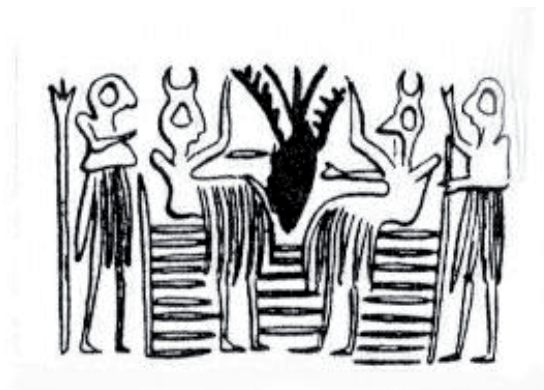
Fig. 6 – Déroulement de cylindre protodynastique, GMA 1359, Kish.

détail est interprété en fonction de l'argument de la « partie pour le tout » : ils évoqueraient un plus grand nombre de convives impossible à représenter sur d'aussi petits objets. Cette interprétation illustrative n'est que partiellement satisfaisante. Elle est l'un des meilleurs exemples du fonctionnement de notre façon d'appréhender l'image mésopotamienne. Celle-ci repose sur un certain nombre de présupposés parmi lesquels l'immédiateté du sens par le degré de réalisme de l'image (les tiges seraient des chalumeaux), la similitude avec des scènes plus récentes (les scènes de banquet paléobabyloniennes évoquées plus haut), la conformité au matériel archéologique (la découverte de filtres) et la perspective à la fois herméneutique et évolutionniste que l'on peut conférer à l'ensemble. En ce sens, cette interprétation opère et est même l'une des plus ancrées dans la tradition iconographique orientale. Il est extrêmement difficile d'attribuer à qui que ce soit la paternité de cette interprétation. On la trouve très tôt chez H. Frankfort, mais il est fort probable qu'elle fut avancée bien plus tôt encore, sans doute dans le courant du XIX e siècle à la faveur de publication de cachets antiques. Cette interprétation illustre toute la difficulté du raisonnement iconographique. Les arguments se superposent à l'image, confortant la lecture, de