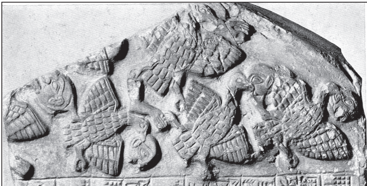
Fig. 5a - Fragment 1 de la « Stèle des vautours », Tello (+ 2550-2400 av. J.-C.) (Musée du Louvre).