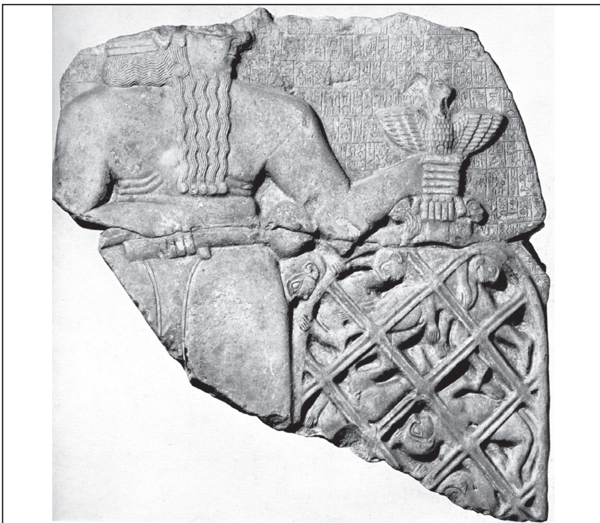
Fig. 5b - Fragment 2 de la « Stèle des vautours », Tello (2550-2400 av. J.-C.) (Musée du Louvre).

techniques qui lui sont nécessaires pour obtenir les denrées dont il a besoin. Pour parvenir à ce résultat, les hommes doivent donc travailler. C'est là une condition considérée comme les distinguant radicalement des animaux. En effet, dans la tradition de pensée occidentale du moins, l'animal est tout simplement ce qui est vivant et ne saurait travailler pour se nourrir. Ainsi Prométhée, puni d'avoir dérobé le feu à Zeus, doit durement travailler pour extraire de la terre sa nourriture.