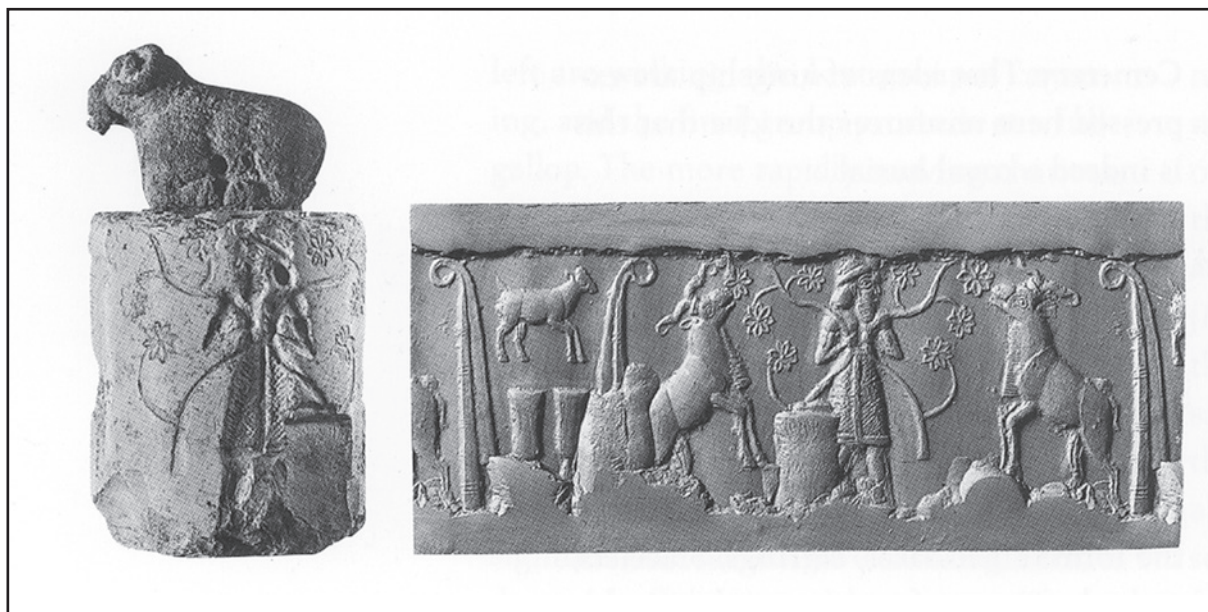
Fig. 1 - Sceau-cylindre de l'époque d'Uruk ; roi nourrissant deux bovidés