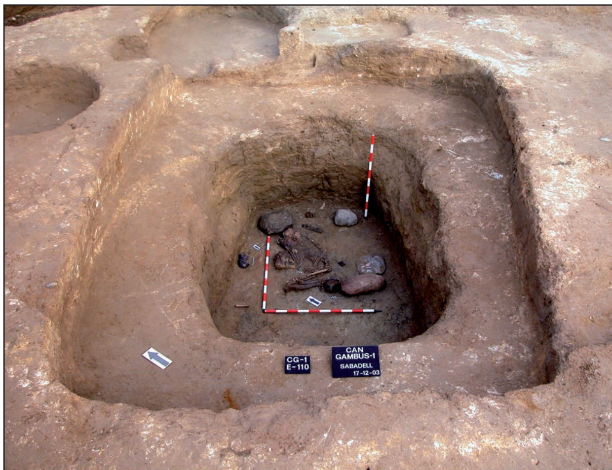
Figure 3 : sépulture E-110 (type A)

une chambre unique de plan rectangulaire ou elliptique. Il s'agit de sépultures très arasées, majoritairement sans couverture. On ne peut pas écarter la possibilité que certaines de ces fosses correspondent en fait aux types A à D (23 sépultures – 49 %).