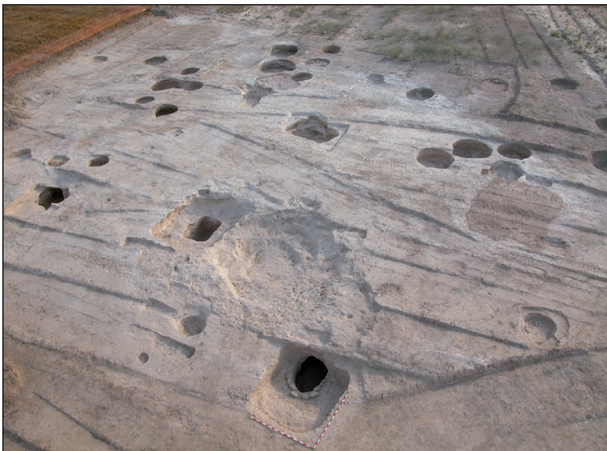
Figure 1 : Vue générale de la fouille de la nécropole

de multiples fouilles depuis un siècle. Un total de 625 structures archéologiques a été fouillé entre 2003 et 2004, appartenant à diverses périodes depuis le Néolithique ancien cardial jusqu'à l'époque contemporaine 3 . Parmi ces témoignages, la nécropole du Néolithique moyen est particulièrement remarquable, par son intérêt historique et sa richesse archéologique (fig. 1).