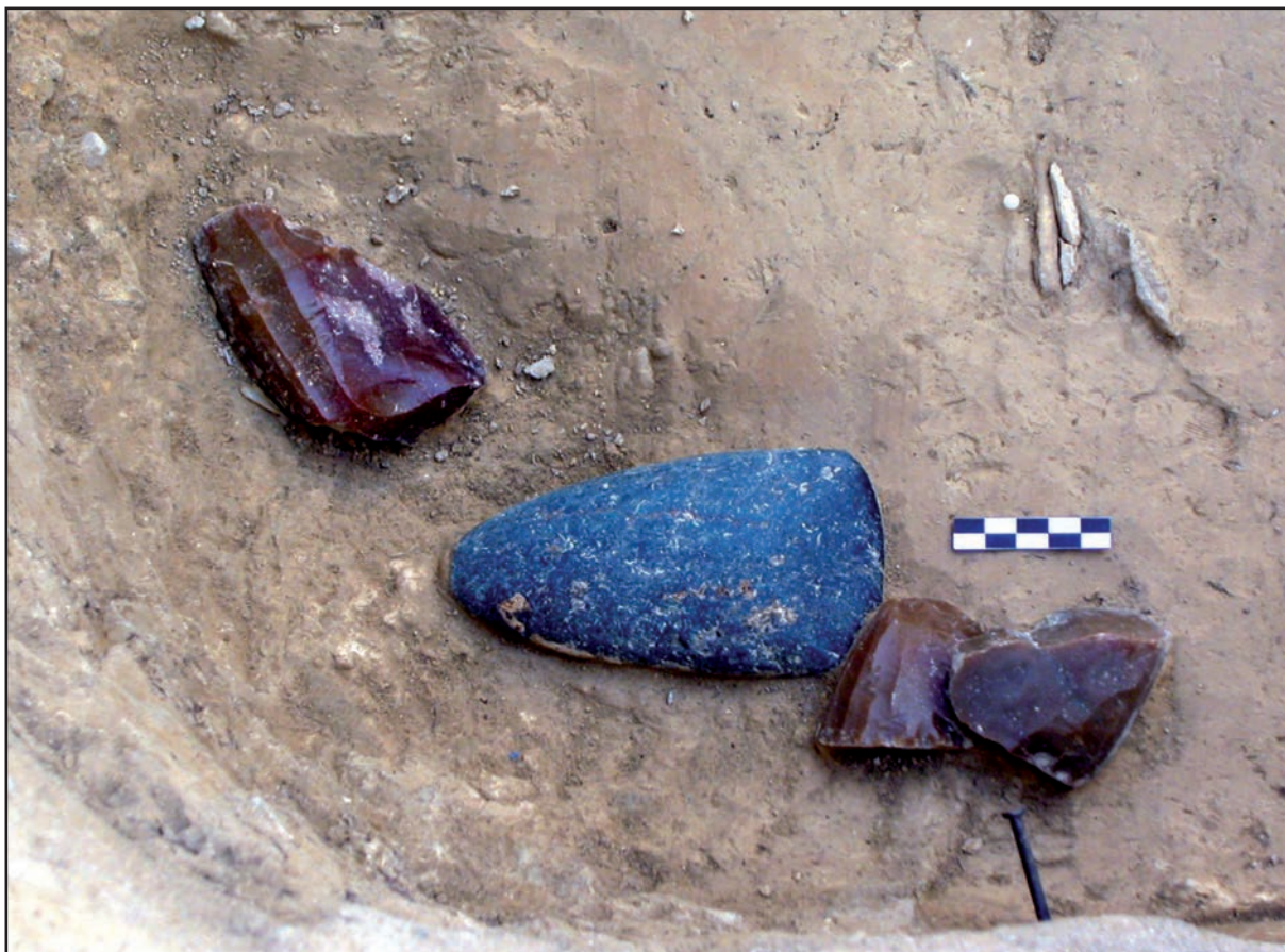
Figure 4 : dépôt de nucléus en silex blond et hache polie dans la tombe E-167 (type A)

Au final, si le nom de la culture des Sepulcros de fosa est révélateur de l'importance des tombes dans le registre archéologique catalan du IV e millénaire, il ne rend pas grâce à la qualité des tombes elles-mêmes !