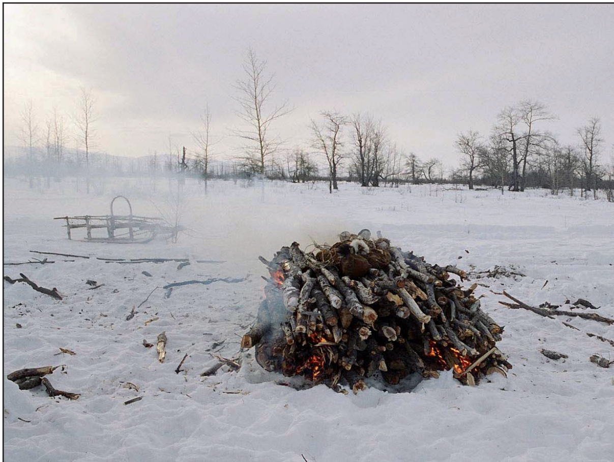
Figure 5 : Le bûcher est enflammé.