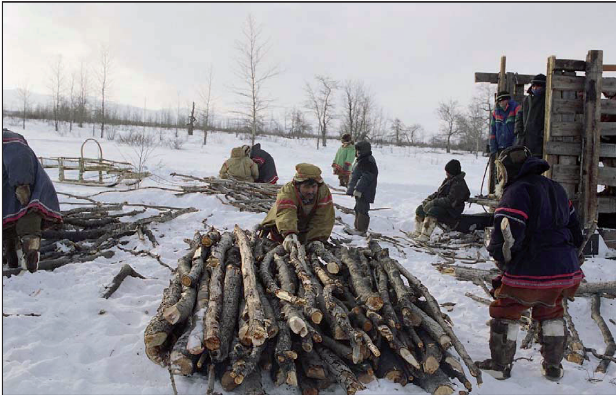
Figure 3 : Mise en place du bûcher.