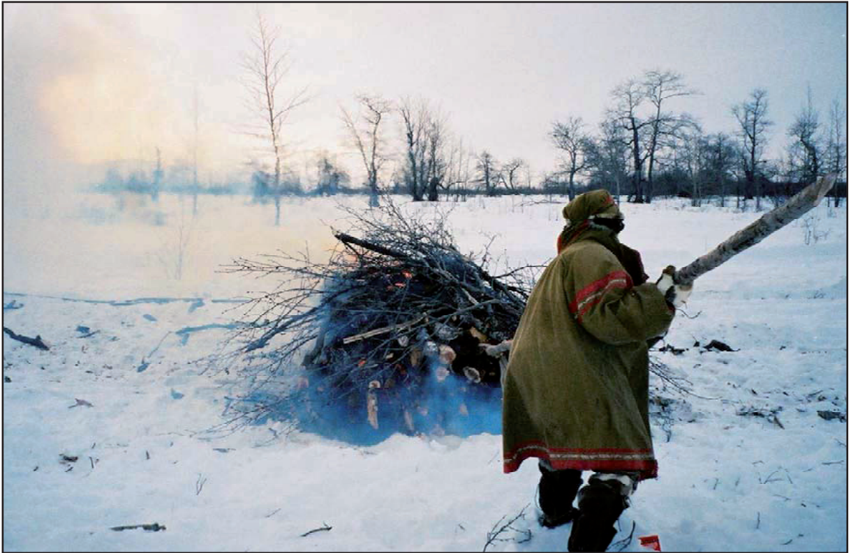
Figure 6 : En même temps que le bûcher en flammes est recouvert de branches, l'officiant active la combustion avec une perche.

d'ici et celui des ancêtres, puisqu'ils font tout pour aider le mort à partir.