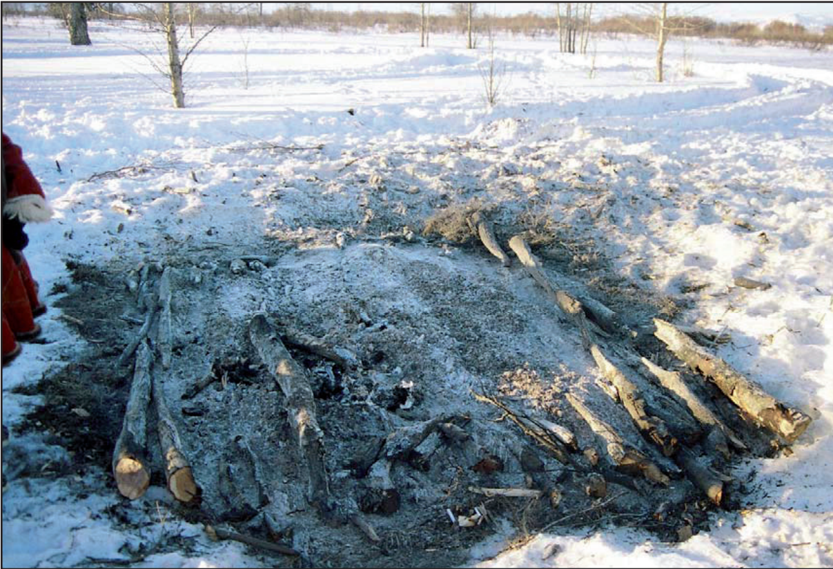
Figure 7 : Ce qui reste le lendemain matin avant que les officiantes ne regroupent vestiges osseux et ligneux.

Un peu plus loin, alors que nous revenons parmi les vivants, des femmes, qui n'ont pas assisté à la crémation, vont nous frapper avec des branches d'aulne attachées de paille pour nous purifier. Elles jettent ensuite leurs bouquets de branches dans les buissons environnants. Devant la maison du défunt, deux rituels se succèdent avant que chacun entre. Les femmes corbeaux attachent une loche avec un lien de paille puis la font tourner dans une bassine d'eau symbolisant le fleuve ; ce rite Koriak vise à favoriser l'abondance des pêches futures. Ensuite, sur le pas de la porte, une femme tend une casserole d'eau à celui entrant, qui en boit une gorgée, puis elle en jette un peu derrière lui. La gorgée que l'on boit, c'est pour soi, celle que l'on jette derrière, c'est pour le défunt, de manière libation partagée.