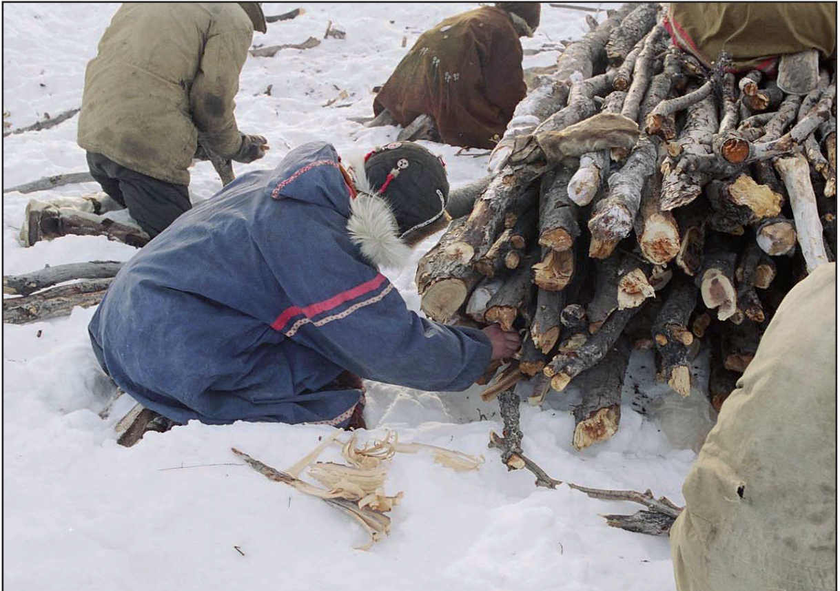
Figure 4 : Préparation et insertion des copeaux de bois pour aider à lancer la combustion.

autour pour s'assurer de la solidité de l'ensemble. Il a fallu environ une heure pour monter la construction. Une femme lui passe alors un branchette qu'il pose transversalement à la tête du bûcher.