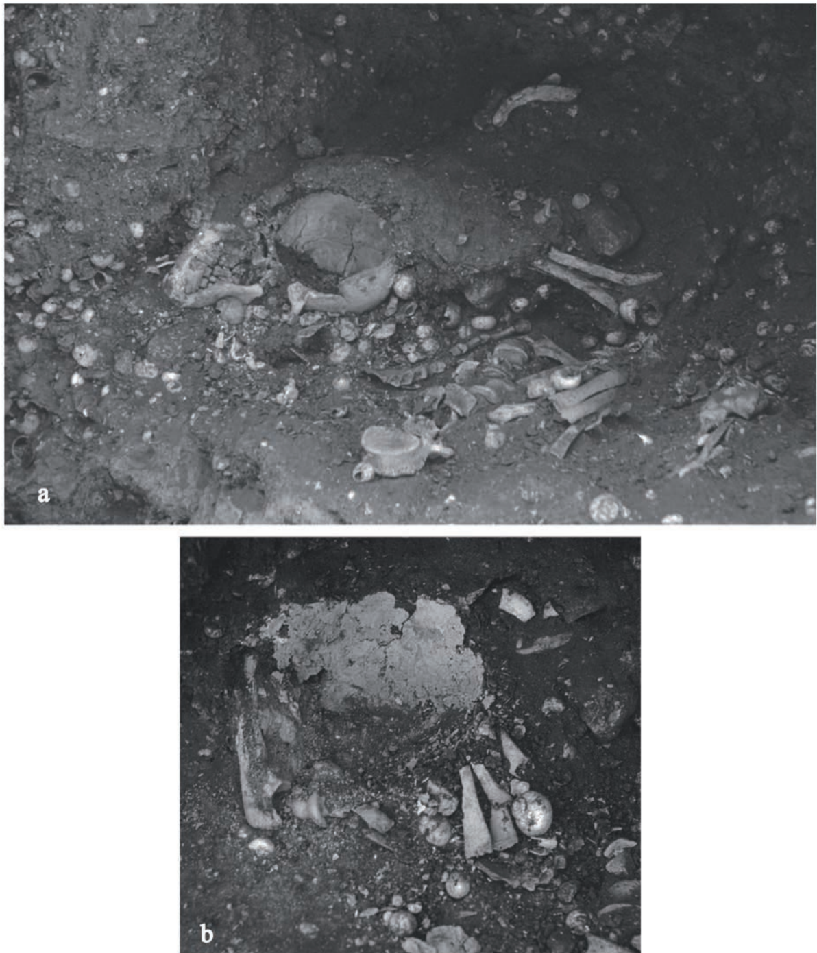
Figure 2 : Sépulture 1 de Faïd Souar (a). On observe à gauche le bloc crânio-facial face à terre. Après démontage du bloc crânio-facial (b). Remarquez à l'emplacement de la voûte crânienne la fine couche in situ du matériau blanchâtre. Les résidus de cette matière paraissent plus irréguliers (en grumeaux) à l'emplacement de la face (d'après G. Laplace 2004 : fig. 9 et 18).

modifié et sa mandibule ont été découverts en connexion (la denture en parfaite occlusion). Sous cet ensemble, on note la dislocation du coude,