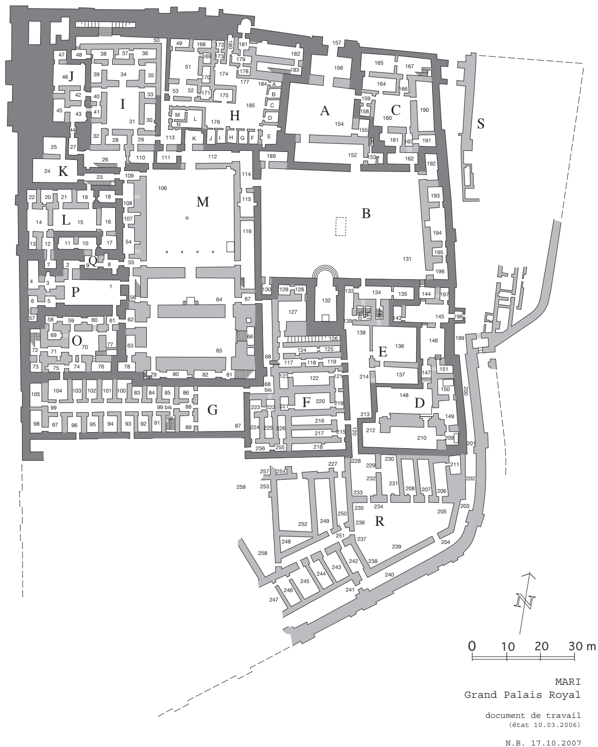
Fig. 1 : Plan du Grand Palais Royal de Mari (début du II e millénaire), analyse des secteurs, (d'après Margueron 2004 : fig. 437. Infographie de Nicolas Bresch).