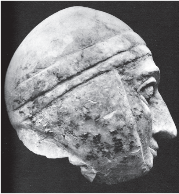
Fig. 3 : Tête de statue dite « Guerrier à la mentonnière », secteur D, escalier 148-210. (Parrot 1959 : pl. XVII).

la femme nue se soutenant les seins (moules du secteur O) et surtout par celles du palmier et des eaux jaillissantes (peinture de l'Investiture, statue