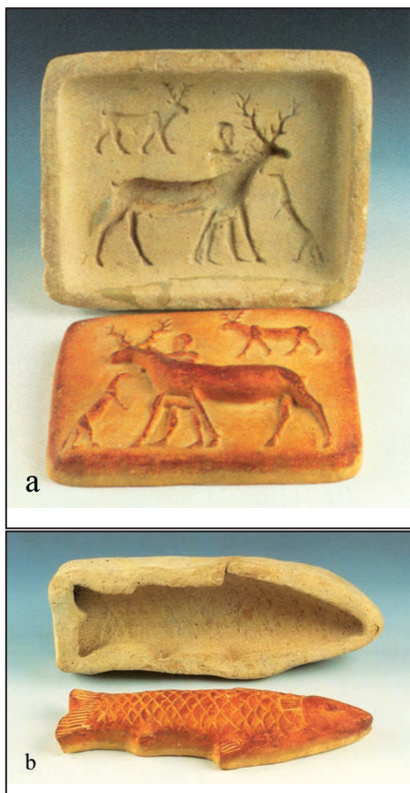
Fig. 2 a et b : Moules à pâtisserie, pièce 77, secteur 0, (d'après Fortin 1999 : 101, n° 35 et 36).

qui se cantonne exclusivement aux secteurs religieux et à la Maison du Roi. Le lion pour sa part ne paraît pas lié aux temples et sort quelque peu de la Maison du Roi – en tant qu'attribut d'Ishtar vraisemblablement. Les animaux domestiques – équidés, caprinés, chiens – sont somme toute peu nombreux et disséminés dans le palais, à l'exclusion du secteur religieux D.