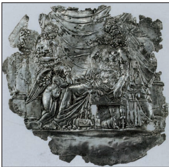
Fig 1 : Miroir d'argent pompéien avec Phèdre (d'après Guzzo 2006 : fig. p. 101)

parler d'un « motif de Phèdre » 1 . Ce motif apparaît pour la première fois sur un miroir en argent pompéien d'époque augustéenne 2 (fig. 1) : Phèdre y est représentée assise, la tête rejetée vers l'arrière, la main gauche pendante, un Eros pensivement appuyé sur ses genoux ; penchée au-dessus d'elle, sa nourrice semble lui murmurer à l'oreille des paroles de réconfort tandis qu'à gauche une servante contemple la scène avec tristesse. Répétée sur toutes sortes de supports 3 , l'image de cette femme défaillante, soutenue par ses compagnes, a connu un succès particulier dans le décor des sarcophages d'époque impériale puisqu'on la rencontre sur une quarantaine d'exemplaires issus d'officines romaines 4 et sur près d'une trentaine de monuments d'origine attique 5 . Sur les premiers, le motif apparaît toujours sur la face antérieure