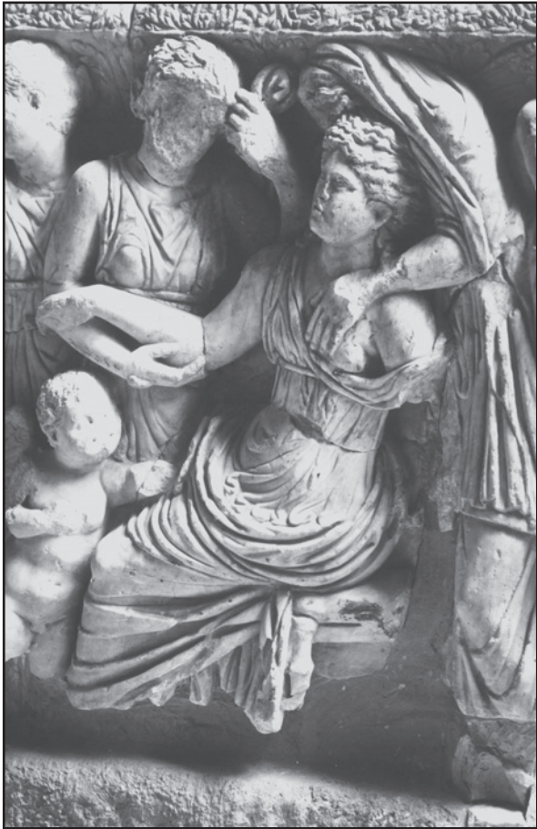
Fig 2 : Sarcophage attique avec Hippodamie (d'après Linant de Bellefonds 1985 : pl. 63, 2)

du sarcophage où il est intégré à une composition plus vaste montrant aussi le départ d'Hippolyte pour la chasse ; sur les seconds, il est tantôt isolé sur un petit côté de la cuve, tantôt intégré au décor de la face principale. Le même groupe apparaît enfin sur la face antérieure d'un sarcophage attique illustrant la découverte d'Achille à Skyros en présence de Déidamie 6 et sur le petit côté d'un autre sarcophage attique illustrant le mythe de Pélops et Hippodamie 7 (fig. 2), ce qui nous amène à poser la question de la signification du motif pour un spectateur de l'antiquité : que représentait cette femme assise dans une attitude