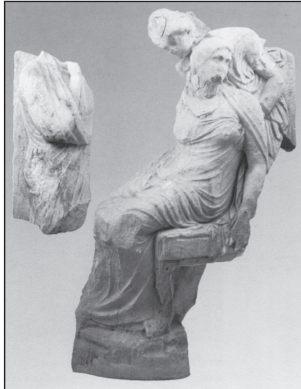
Fig 3 : Stèle funéraire de Thasos (d'après Grandjean et Salviat 2000 : fig. 198)

de profonde souffrance ? Y voyait-on Phèdre, Déidamie, Hippodamie, une femme à l'agonie, ou encore la destinatrice du sarcophage ?