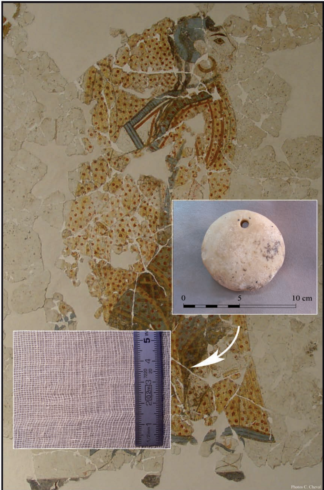
Figure 2: peson en marbre d'Akrotiri et tissu réalisé avec ce type de peson, sur fond de fresque d'Akrotiri montrant un tissu transparent.