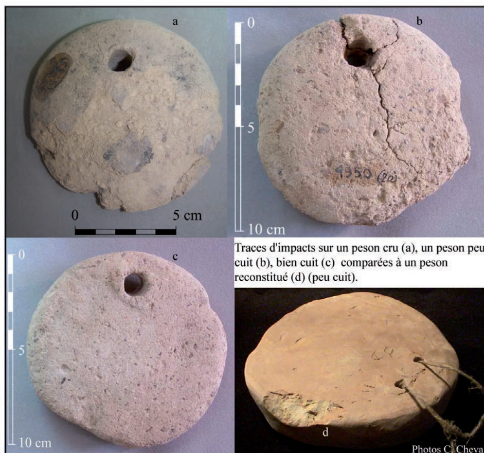
Figure 5: traces d'impacts sur un peson cru, un peson peu cuit, bien cuit comparées à celles d'un peson reconstitué (peu cuit).

pesons en série. La cuisson n'est pas indispensable au bon fonctionnement des pesons en argile. De nombreux individus ont été retrouvés crus, d'autres ne semblent avoir été cuits qu'accidentellement lors d'incendies. L'expérimentation, sur une longue période, de pesons « malmenés » au bas de la chaîne nous a permis de constater que les pesons en argile crue résistent parfaitement et montrent des traces d'impacts similaires à ceux que nous pouvons observer sur le matériel archéologique. Cette constatation vaut pour les formes épaisses (comme les pyramides tronquées par exemple), mais aussi pour les formes fines tel que les pesons lenticulaires. L'étape de la cuisson est un investissement supplémentaire dont on savait se