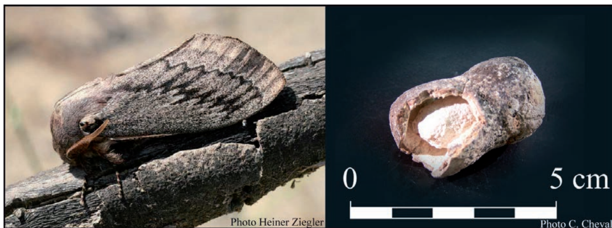
Figure 3: Pachypasa otus (L.) et le cocon d'Akrotiri

identifiées) et en marbre. Ce sont des objets plutôt légers.