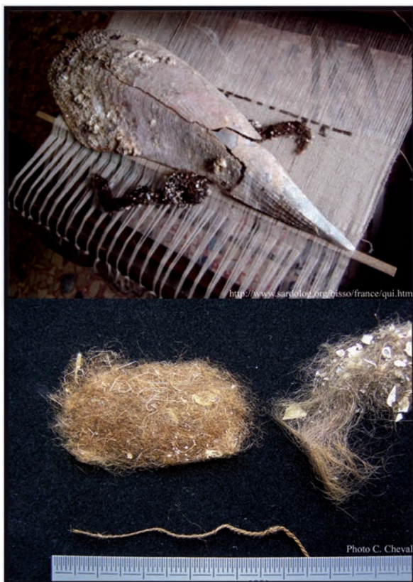
Figure 4: Pina nobilis