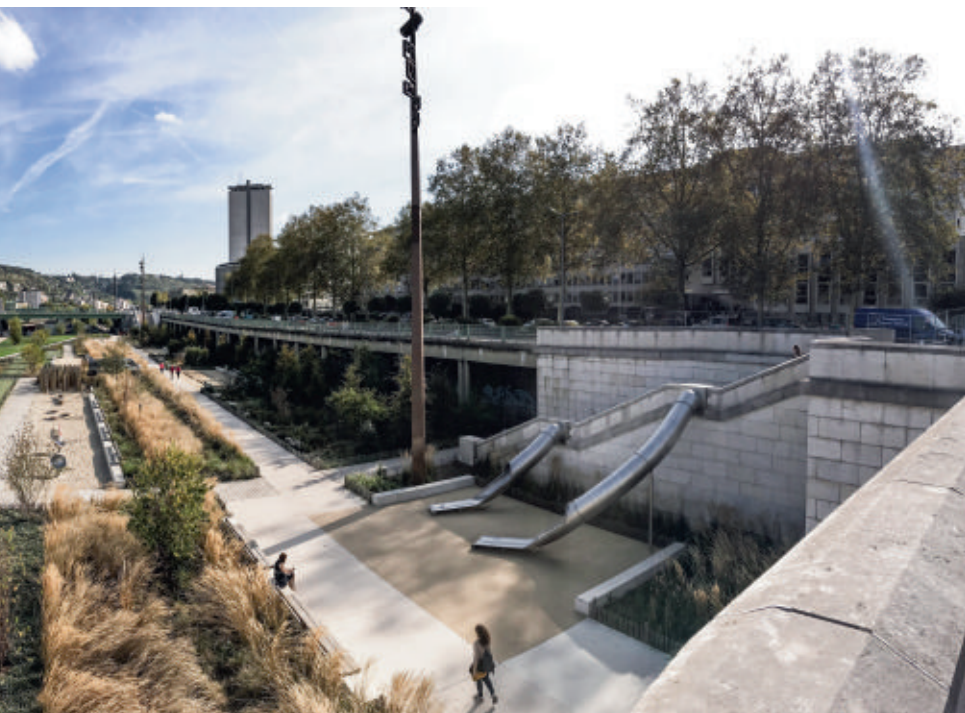
Figure 1 - Quais de la Seine rive gauche, à Rouen