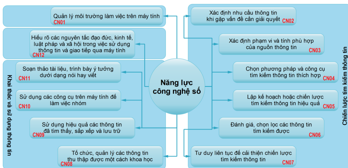
Hình 2. Mô hình nghiên cứu về năng lực công nghệ số tại bốn chương trình đào tạo tham gia đánh giá AUN-QA ở Việt Nam giai đoạn 2009-2014.

được ký hiệu “CN” (viết tắt của “ Compétences numériques ”, nghĩa là “ Năng lực công nghệ số ” trong tiếng Pháp) và đánh số từ 01 đến 12.