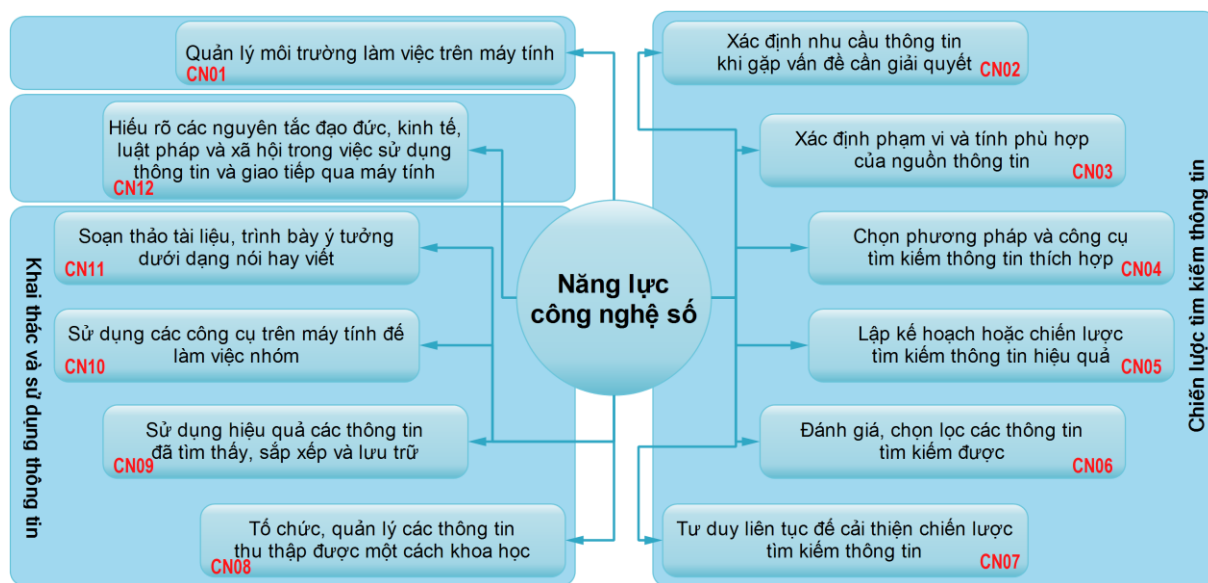
Hình 2. Mô hình nghiên cứu về năng lực công nghệ số tại bốn chương trình đào tạo tham gia đánh giá AUN-QA ở Việt Nam giai đoạn 2009-2014.

được ký hiệu “CN” (viết tắt của “ Compétences numériques ”, nghĩa là “Năng lực công nghệ số” trong tiếng Pháp) và đánh số từ 01 đến 12.