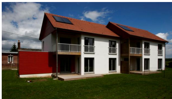
Figure 1. Vue des maisons étudiées (Arch.: En Act architecture)

Afin d'illustrer la démarche, une application est présentée concernant les premières maisons passives construites en France, en 2007 à Formerie (Oise) par l'entreprise Les Airelles Construction (Figure 1). Une maison passive mobilise davantage de matériaux qu'une maison standard (isolant plus épais, triple vitrage, chauffe eau solaire etc.). L'analyse de cycle de vie permet alors d'évaluer l'intérêt global de ce concept, en prenant en compte l'impact supplémentaire de la fabrication des produits mais aussi l'énergie économisée dans la durée.