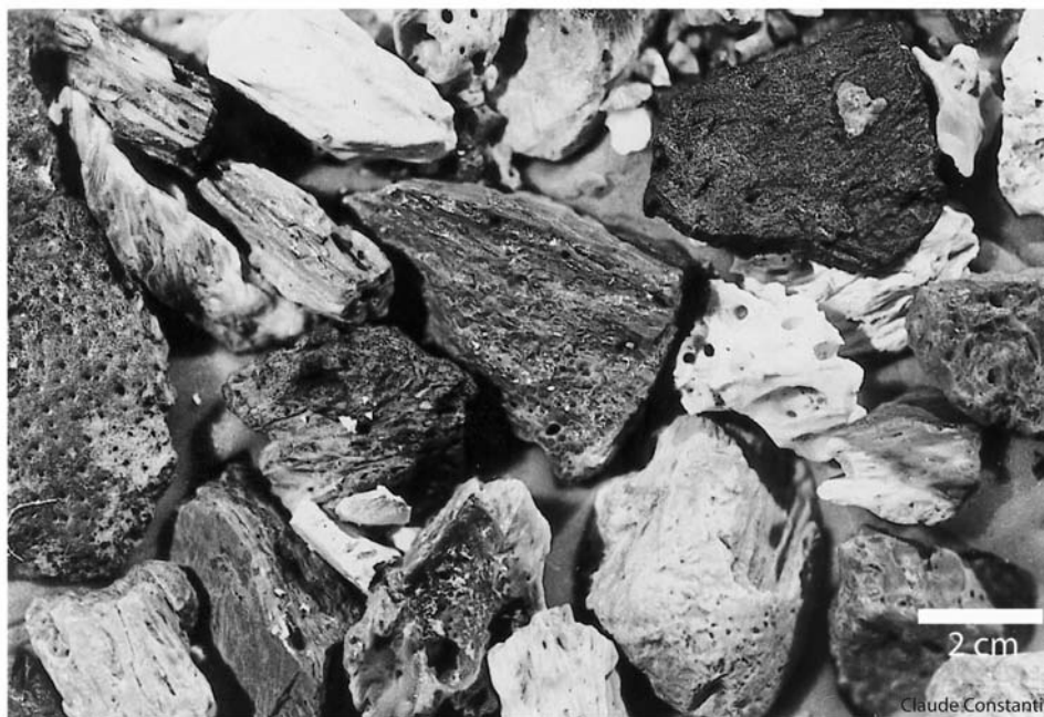
Fig. 1. Fragments d'os utilisés comme dégraissant (extraits de tessons).