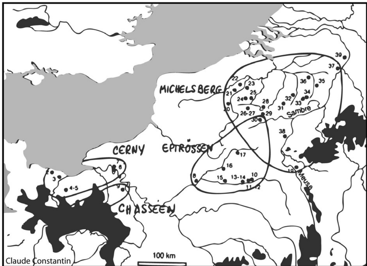
Fig. 4. Développement chronologique de l'utilisation de mousse comme dégraissant du sud-ouest vers le nord-est (d'environ 4500 à 3800 BC).