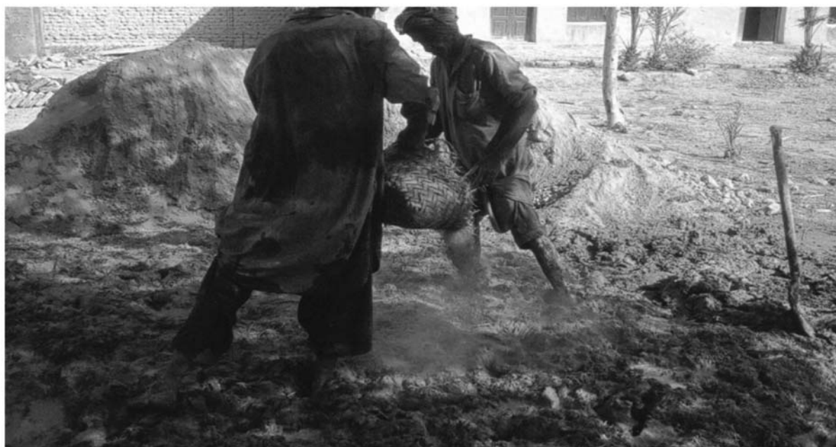
Fig. 1. Incorporation d'un dégraissant végétal (résidu du battage de blé froment) à l'argile destinée à la fabrication de briques crues, Makran Pakistanais.

vêtues comme l'engrain ( T. monococcum ), l'amidonner ( T. dicoccum ), l'épeautre ( T. spelta ) ou l'orge vêtue ( Hordeum vulgare ). En se décomposant, les différents éléments du dégraissant végétal laissent des empreintes sur l'argile. Celles-ci sont occasionnellement utilisées par les archéobotanistes afin de compléter les informations obtenues par une étude carpologique « classique », c'est-à-dire fondée sur l'identification des graines et des fruits (Helbaek, 1948 ; Willcox & Fornite, 1999 ; Willcox & Tengberg 1995). En effet, les empreintes permettent d'observer les parties fragiles des céréales, telles glumes et glumelles (voir infra ) qui sont rarement préservées dans les sédiments archéologiques. De surcroît, ces éléments ont souvent une valeur diagnostique permettant de préciser l'identification d'une céréale jusqu'à l'espèce, voire la sous-espèce. Outre