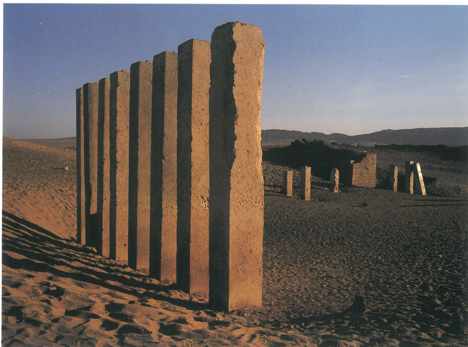
Ma'rib. Piliers du sanctuaire d'Almaqah partiellement dégagé en 1951. Yémen.