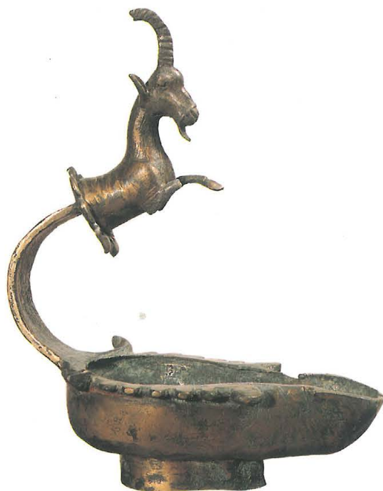
Lampe en bronze au manche terminé par un protome de bouquetin (ibex). Musée de Sanaa.

tuaire aux oracles renommés. Ainsi, par ce carrefour, s'opèrent des échanges qui placent La Mecque dans le circuit de l'économie internationale, tandis que les pèlerinages contribuent à atténuer le cloisonnement tribal. La mémoire encore imprégnée des tentatives d'union en grandes confédérations, les marchands de La Mecque tentent par l'islam de refaire l'unité des Arabes du Nord et du Centre. A la fin du VII e siècle, leur victoire consacre l'instauration d'un État unique dans la péninsule arabique.