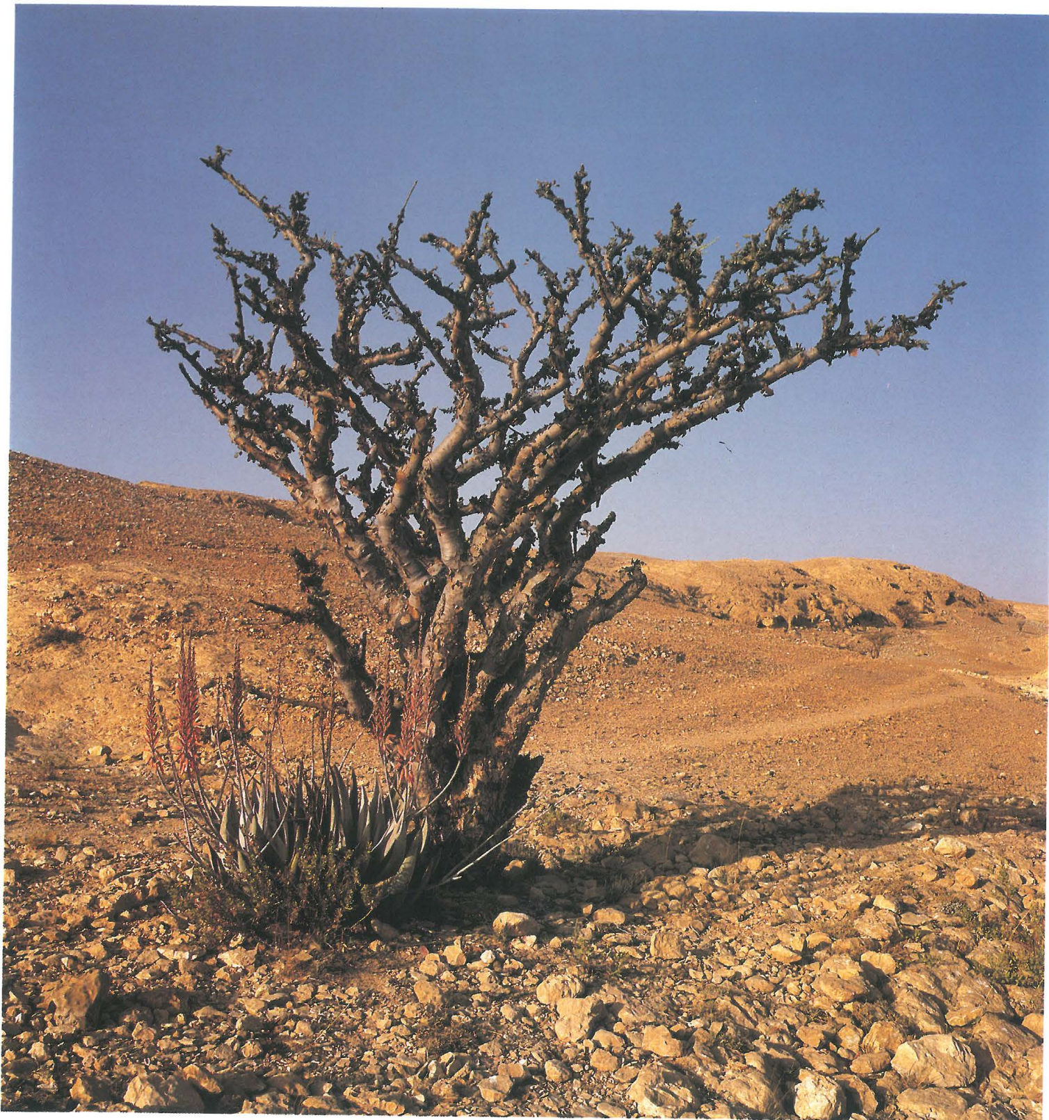
Arbre à myrrhe. Région de l'Hadramaout. Yémen.