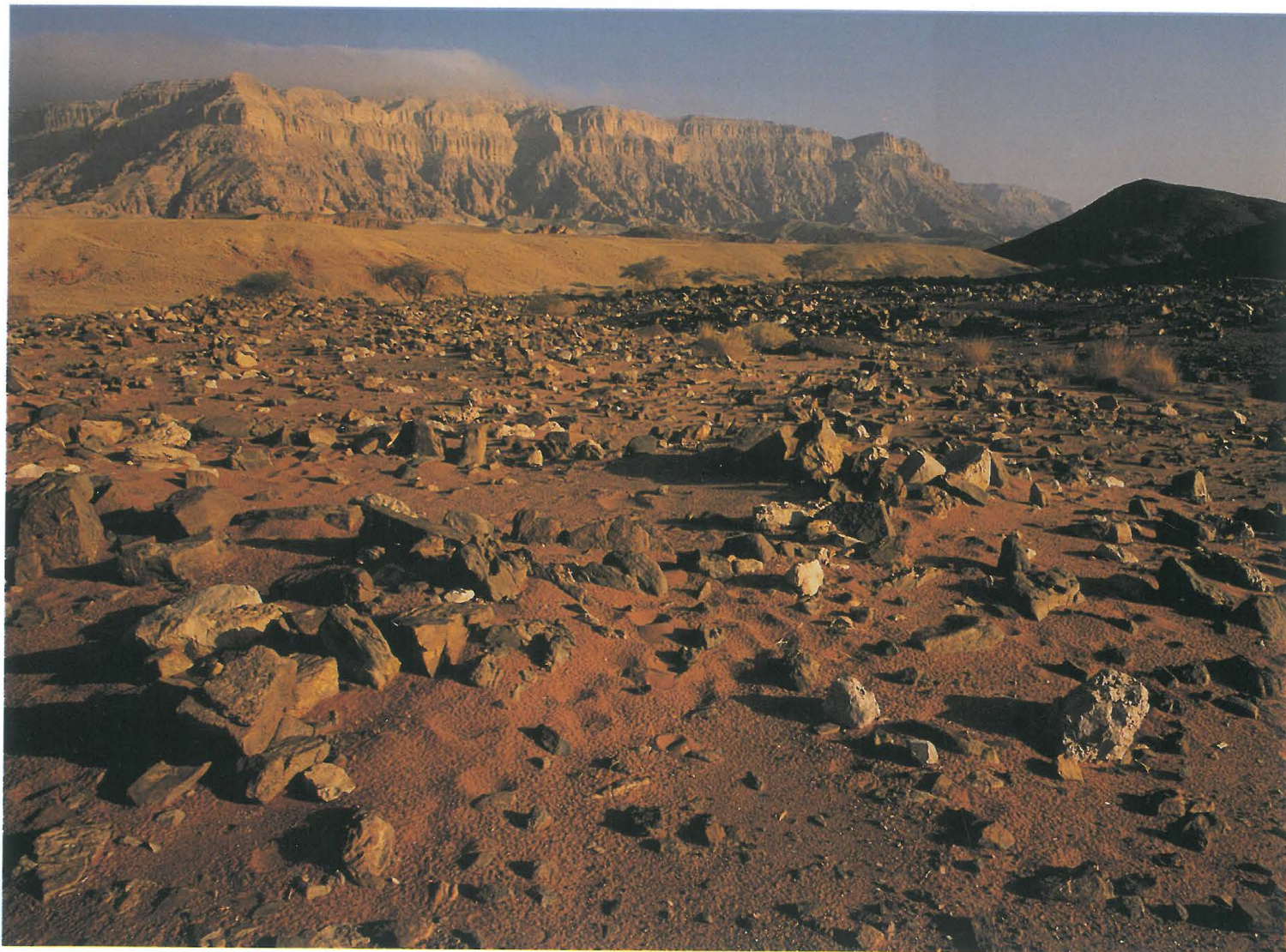
Mines du roi Salomon à Timna'. Nord-ouest d'Éilat. Israël.