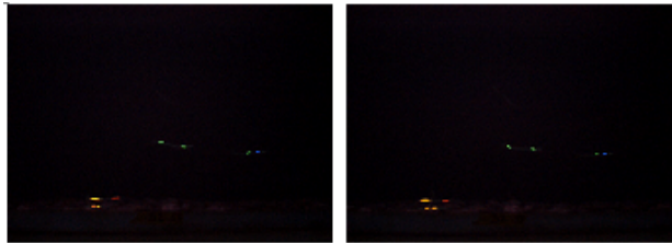
a) instant t b) instant t + dt ( dt = 67ms )

Les algorithmes s'appliquent sur 2 images successives. L'exemple en Fig. 1 comporte 4 civelles marquées : les 2 premières se trouvent en bas à gauche dans l'image, l'une avec un marquage double orange-orange court (rapproché) codé OOC, et l'autre, juste au dessus, avec un marquage orange-rouge long (espacé) codé ORL ; la 3ième se situe au milieu de l'image avec un code vert-vert long (VVL) ; la 4ième est à droite avec un code bleu-vert court (BVC). Le sens du courant de marée va de la droite vers la gauche de l'image ( \leftarrow ). Les civelles OOC et ORL nagent avec le courant, tandis que VVL et BVC nagent à contre-courant.