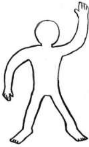
Figura 1. Patrón para la realización del retrato lingüístico (Busch, 2012: 511)

solicitó que los representaran en una silueta vacía (Figura 1) y con diferentes colores sin pensar en estas como categorías delimitadas o nacionales.