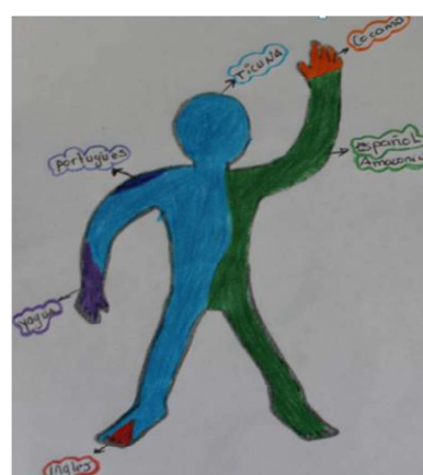
Figura 5. Retrato lingüístico de Pedro