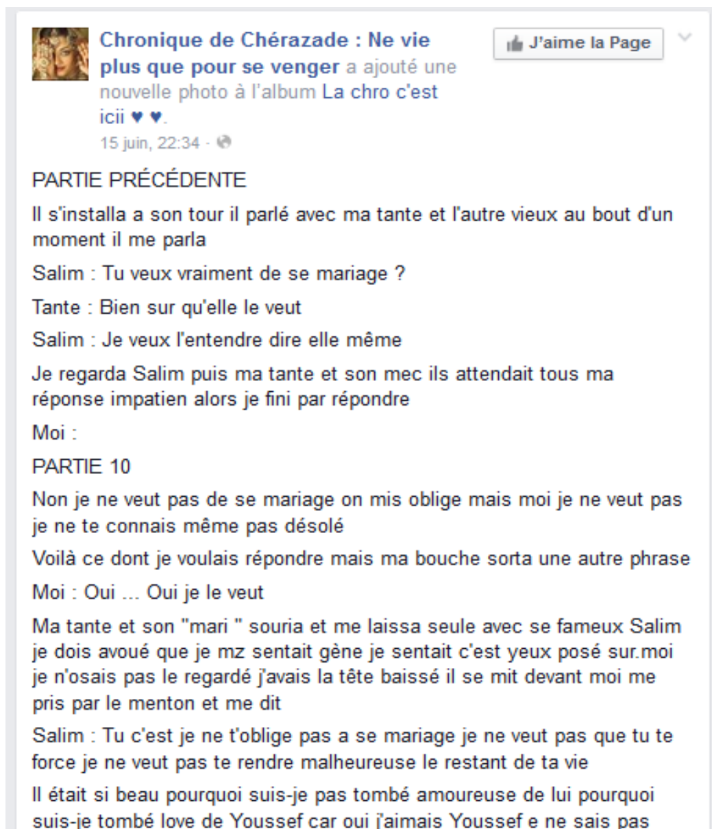
Illustration 8 - Extrait d'une partie d'une chronique : l'affranchissement vis-à-vis des codes d'orthographe et de syntaxe