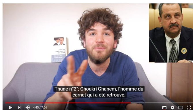
Figure 3. Exemple de geste co-verbal rythmant le discours (vidéo 87).