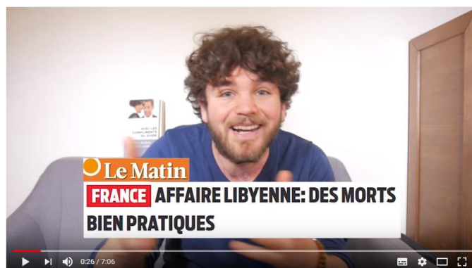
Figure 4. Incrustation iconographique indiquant la source de l'information (vidéo 87)

On note un travail de vulgarisation pédagogique au travers de l'emploi d'un lexique adapté à des non-initiés à la politique et au décryptage médiatique, d'éléments humoristiques « Fais pas bon être Monsieur Tune en Libye », d'hyperboles et de répétitions. Enfin, des éléments iconiques et graphiques viennent s'ajouter, éléments qui illustrent, renforcent et étayent l'explication, comme dans la Figure 4.