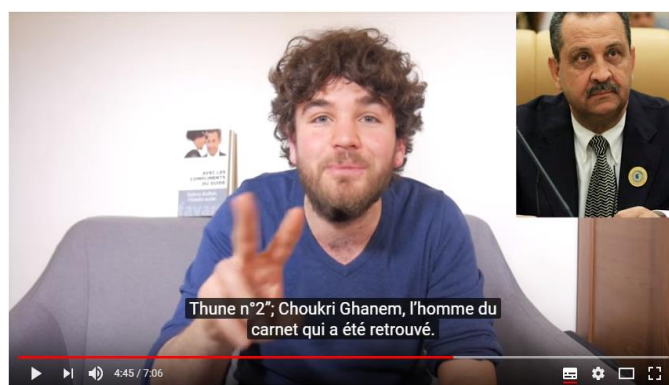
Figure 3. Exemple de geste co-verbal rythmant le discours (vidéo 87).