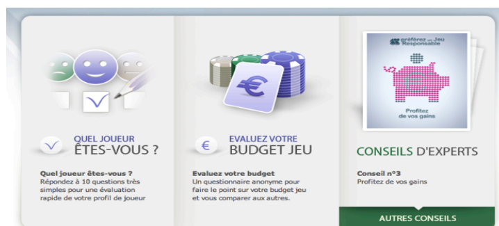
Figure 1 : trois grandes parties du dispositif Barrière

Dans la première partie du dispositif Quel joueur êtes vous ? neuf questions sont posées à l'internaute : Au cours des 12 derniers mois, à quelle fréquence avez-vous... :