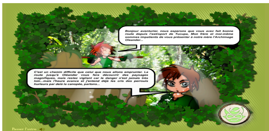
Figure 7 : Extrait de l’animation en introduction du premier monde visité, Végétalia

Enfin, les graphismes sont tout droit sortis de bandes dessinées. Statiques, il s’agit de montages/animations/dessins en couleurs (types mangas) par lesquels les personnages imaginaires (combattants) partent avec l’internaute à la conquête de mondes.