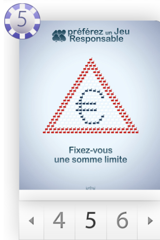
Figure 6 : Extrait de l’animation de la rubrique “Conseils pour un Jeu Responsable”

Nous sommes ici dans une approche illustrative de conseils. Le dessin fait penser aux illustrations intégrées aux jeux vidéo des années 1980 et n’apporte pas plus d’information que celle véhiculée par le texte.