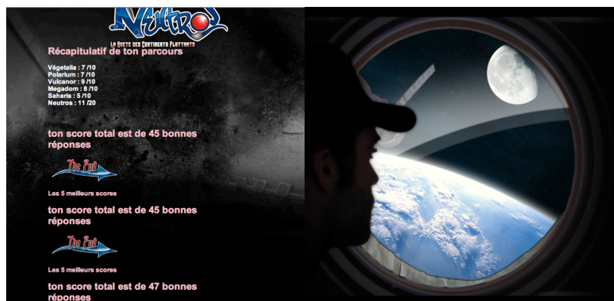
Figure 4 : bilan des scores de l'internaute et décollage de la navette Neutros

L'aventurier-internaute doit visiter consécutivement les cinq autres planètes et répondre pour chacune d'elles à dix questions proposées de manière aléatoire, parmi une trentaine possibles. Lorsqu'il parvient à visiter les cinq continents et à répondre aux questions avec un minimum de cinq réponses correctes, l'aventurier-internaute décolle alors pour la planète Neutros :