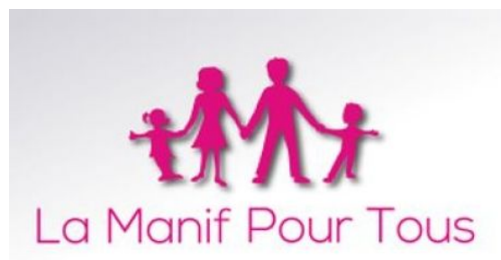
Figure 1. Logo du mouvement « La Manif pour tous »

Pendant la controverse elle-même, et en particulier dans les manifestations, la « Manif pour tous » s'est appuyée sur une représentation de la famille constituée d'un père, d'une mère et de deux enfants, un garçon et une fille, représentation qui s'est incarnée dans le logo du mouvement (cf. Fig.1). Ce modèle s'est vu renforcé dans les manifestations par l'usage du rose et du bleu, les couleurs marquant traditionnellement la différenciation des genres.