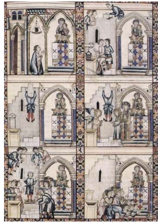
Fig. 1 : Florence, Bibliothèque nationale centrale, ms. B. R. 20 (vers 1281-1284). Détail (fol. 88) : Le maçon miraculeusement sauvé