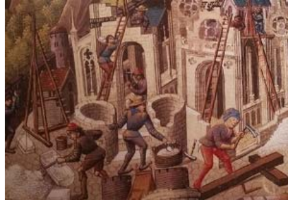
Fig. 11 : Mâcon, BM, ms. 1 (vers 1480). Détail (fol. 172) : Construction du temple de la vertu © Emmanuelle JEANNIN, Chantiers d'abbayes , Moisenay, Éditions Gaud, 2008, p. 25. Ouvrier portant une hotte et un oiseau afin de monter des moellons à l'étage d'une tour.

agripper les montants ou les barreaux de l'échelle. La charge est ainsi également répartie sur les épaules, ce qui donne au corps une plus grande latitude dans ses mouvements.