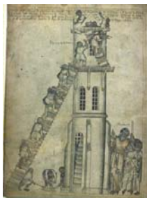
Fig. 7 : Londres, British Library, ms Egerton 1894 (vers 1360). Détail (fol. 5v) :

Construction de la tour de Babel © François ICHER, Les ouvriers des cathédrales , Paris, Éditions de la Martinière, 2012, p. 98. Les ouvriers présents sur la miniature après avoir réalisé du mortier au sol le montent à l'aide d'oiseaux et d'un bard. Les ouvriers ainsi approvisionnés réalisent des enduits et des maçonneries de moellons. Il semble cependant compliqué pour des ouvriers de monter sur une rampe inclinée de telle sorte.