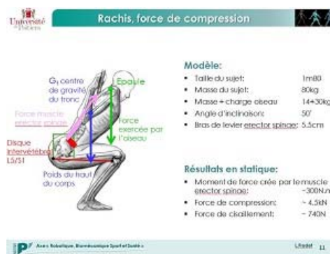
Fig. 10 : © Laetitia Fradet.

Malgré le fait que nous n'ayons pas, hormis les miniatures, de renseignements plus précis concernant le port de charges à l'époque médiévale, les apports scientifiques contemporains nous éclairent et nous laissent imaginer les dégâts causés aux individus par leur poids – les bâtiments encore visibles nous permettant aussi d'entrevoir aisément les volumes transportés.