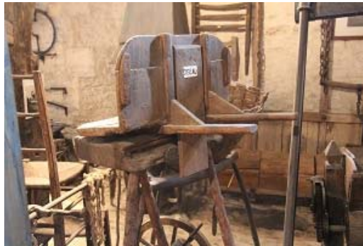
Fig. 8 : Oiseau.

Pour évaluer l'impact de l'oiseau sur le corps, nous avons fait appel à Laetitia Fradet 8 qui a réalisé spécifiquement pour cet article une étude sur les forces de compression et de cisaillement subies par l'interface lombaire 5 (L5) et sacrum 1 (S1) d'un individu d'1,80 m et pesant 80 kg. Nous pouvons voir sur la fig. 9 que la force de compression maximale pouvant normalement être exercée sur L5/S1 (d'après la Recommandation du National Institute for Occupational Safety and Health – NIOSH) 9 , ne devrait pas excéder 3,5 kN.