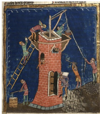
Fig. 2 : HLB Fulda Aa 88 (vers 1350-1375) Détail (fol. 16r) : Construction de la tour de Babel La représentation du chantier montre de gauche à droite un ouvrier préparant du mortier à l'aide d'un bouloir, un ouvrier transportant un bloc de pierre sur le dos, un autre piochant tandis que le dernier fait monter, à l'aide d'une corde passant dans une poulie un panier de pierres, celui-ci réceptionné à son tour par un autre ouvrier. Deux ouvriers, montant sur une échelle, approvisionnent également le chantier.

En prenant comme exemple la miniature ci-dessous (fig. 2), nous pourrions, en effet, nous demander si les postures de l'homme debout portant un seau sur l'échelle, de l'ouvrier entrant dans la tour, ou de celui qui tient la corde alors qu'il se trouve dans le vide s'avèrent envisageables et, par conséquent, étudiables grâce aux données scientifiques sur les risques liés à l'activité physique dont nous disposons aujourd'hui.