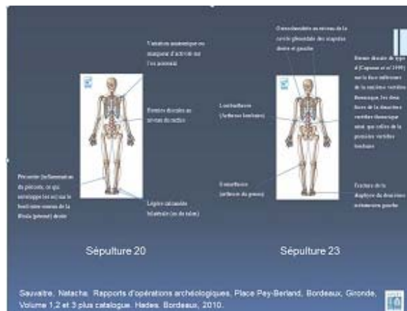
Fig. 14 : © Thierry Grégor.

Certains sujets, pas forcément issus d'une classe sociale moins aisée, appartiennent probablement à un milieu professionnel artisanal (maçon, tisserand, charpentier, tailleur ...) et/ou agricole. Les décors d'outils apposés sur les couvercles des sépultures 20 et 23, respectivement un taillant et une doloire pourraient donner un indice sur le corps de métiers des individus inhumés. Les pathologies et les marqueurs d'activité remarquables sur les ossements de ces individus témoignent pour certains le port de charges lourde 13 .