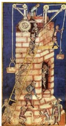
Fig. 4 : Zurich, Zentralbibliothek Ms. Rh 15 (vers 1340-1350) Détail (fol. 6v) : construction médiévale à Altemberg Sur cette miniature, deux ouvriers montent à l'échelle et transportent du mortier dans des seaux.

Le plus simple d'entre eux, le seau en bois ou en fer blanc, peut peser de 3 à 5 kg et avoir une capacité de 10 à 15 l, pour un poids total d'au minimum une quinzaine de kilos. Indispensable pour les liquides, un chantier ayant d'énormes besoins en eau, le seau a l'inconvénient d'être porté à bout de bras, ce qui implique torsion et flexion de la colonne vertébrale. Ce mouvement est parfaitement visible sur la miniature en fig. 4 où l'ouvrier semble être en équilibre et effectivement gêné sous le poids de sa charge. La plupart du temps, pour éviter cette torsion et répartir la charge, l'ouvrier préfère porter deux seaux moins remplis, soit un dans chaque main, soit sur une perche portée sur les épaules. On peut également voir sur certaines miniatures qu'une partie de l'approvisionnement en eau du chantier, notamment celui des parties supérieures des échafaudages, se fait de préférence en montant les seaux avec une corde et une poulie, celle-ci permettant de rester au sol et de démultiplier l'effort réalisé par l'ouvrier. Le reste de l'approvisionnement, d'un point à un autre du chantier, se fait en revanche en utilisant des récipients plus grands, des cuveaux, portés par deux hommes qui les soulèvent avec une barre. Dans ce cas, le poids porte sur une épaule, ce qui provoque des tassements et des torsions de la colonne, ainsi que des traumatismes pour le squelette.