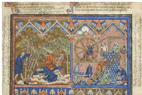
Fig. 3 : New York, Pierpont Morgan Library, Manuscript. M.638 (vers 1244-1254). Détail (fol. 3r) : Construction de la tour de Babel

Dans la fig. 3, nous voyons un bâtisseur gravissant une rampe portant du mortier avec une feschine , un outil de portage composé de paille enveloppée de toile épaisse et d'un bandeau, toujours en toile, venant prendre place sur le front 4 . Ces « porte-pièce » montent une charge qui peut peser jusqu'à 110 kg. Le poids de la pierre, la charge répartie sur les épaules et la tête, ainsi que les mouvements répétitifs de rotation du bassin et de la colonne impliquent une pression très importante sur cette dernière et sur le squelette.