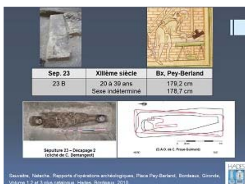
Fig. 13 : © Natacha Sauvaitre, Hades.

En revanche, le couvercle du sarcophage de la sépulture 23 (fig. 13) porte la gravure d'un outil de charpentier utilisé pour amincir ou régulariser l'épaisseur d'une pièce de bois : la doloire. Deux individus prenaient place dans ce sarcophage : un adulte (23A) de plus de 20 ans de stature indéterminée en position primaire couché sur le dos ; et un second individu (23B) de sexe indéterminé, d'environ 1,79 m, d'âge compris entre 20 et 39 ans, posé en position secondaire sur les pieds et les chevilles du premier individu. Le second individu faisait état de diverses pathologies : une lombarthrose ; une hernie discale ; une gonarthrose et une fracture sans déplacement osseux. Une variation anatomique (ou marqueur d'activité) est également visible, notamment une ostéochondrite au niveau de la cavité glénoïdale des scapulas droite et gauche, c'est-à-dire une atteinte liée à une réaction d'opposition de l'épaule à une force compressive, tel par exemple un port de poids.