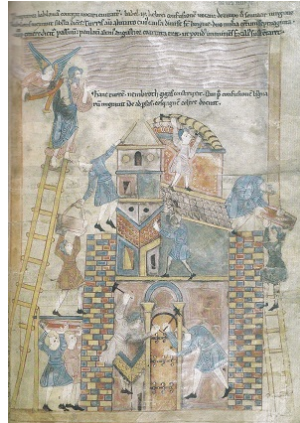
Fig. 6 : Londres, British Library, ms Cotton Claudius B. IV (vers 1025-1050). Détail (fol. 19) : Construction de la tour de Babel. Scène de chantier montrant des ouvriers en activité mais surtout l’approvisionnement de celui-ci à l’aide de paniers et d’auges en bois qui sont passés par des ouvriers montés sur un échafaudage et une échelle.

Les ouvriers médiévaux ont utilisé également d’autres contenants tels l’oiseau 5 (fig. 7 et 8) et la hotte qui, portés sur les deux épaules, permettent de mieux répartir la charge.