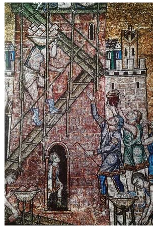
Fig. 5 : Mosaïque Basilique Saint-Marc, Venise (vers 1220-1230). Détail : Construction de la tour de Babel Des ouvriers approvisionnent des matériaux dans des paniers puis les font parvenir en haut d'une tour à l'aide d'une rampe. Les paniers semblent un peu disproportionnés par rapport aux ouvriers, s'ils sont entièrement chargés, cela représente un poids énorme.

Des paniers , réalisés en vannerie, sont également utilisés sur les chantiers. Plus légers que les seaux et les auges en bois, mais moins résistants, ils servent à transporter les matériaux et le mortier. Leur port sur une épaule (comme en fig. 5, cette fois-ci une mosaïque) ou avec les deux mains à l'aide de poignées met la colonne vertébrale en tension et le port à l'épaule produit le même effet de torsion sur la colonne que le seau ou l'auge.