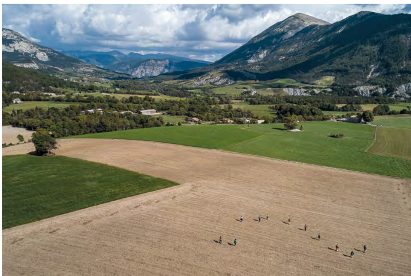
Fig. 13 – THORAME-BASSE et THORAME-HAUTE, Territoires communaux. Panorama de la vallée.

EMERIC (J.) – Prospection-inventaire dans la vallée d'Allos (04) . Mémoire de Master 1 d'archéologie médiévale, Aix-Marseille Université, Aix en Provence, 2011.