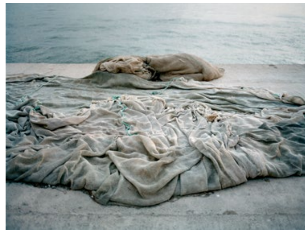
Zarzis, Tunisie, 2012. Ceux dont la mer a gardé les corps ne meurent pas : ils disparaissent. Il arrive que les pêcheurs remontent des corps.

Photo de Laetitia Tura, série Disparitions .