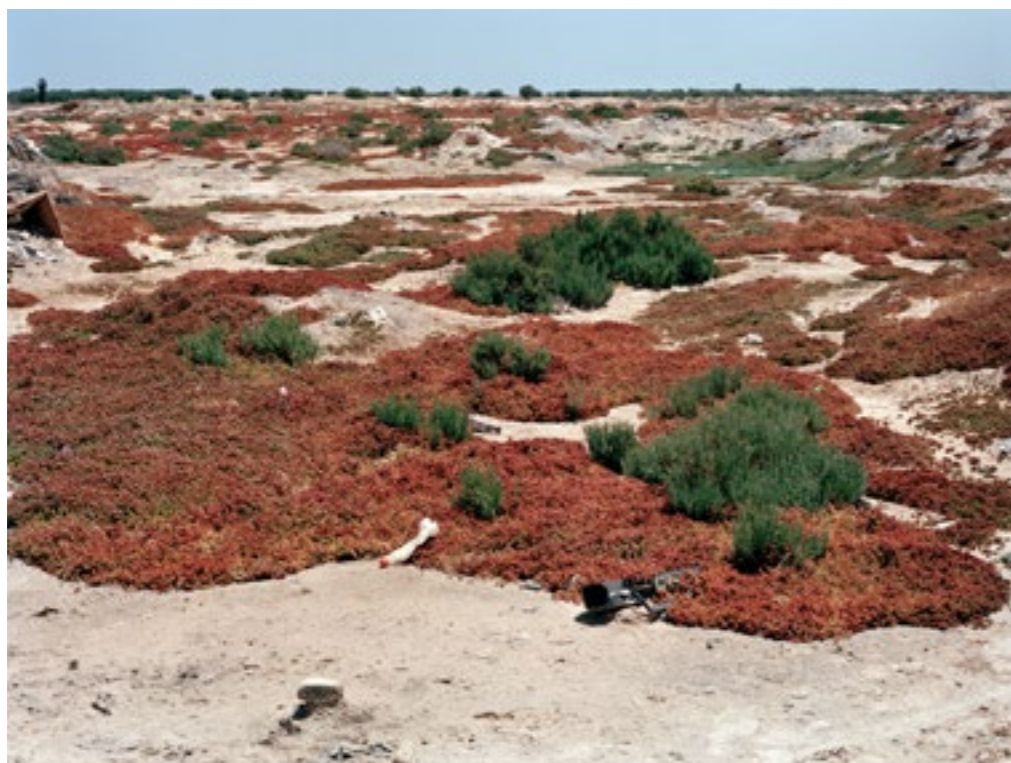
Zarzis, Tunisie, 2012. Les corps échoués sur la plage ont été enfouis dans une décharge devenue fosse commune.

En cas d'échec, malgré les dangers de la traversée, beaucoup affirment qu'ils sont prêts à recommencer. Si certains projettent un autre départ par barque, d'autres veulent explorer des itinéraires migratoires différents. De nouvelles filières s'organisent afin de permettre l'émigration via la Turquie. Les Algériens s'y rendent en avion en prétextant un séjour touristique, puis ils tentent de franchir la frontière gréco-turque en empruntant les itinéraires adoptés principalement jusqu'alors par les migrants venus d'Asie (Afghanistan, Pakistan et Bangladesh). ■