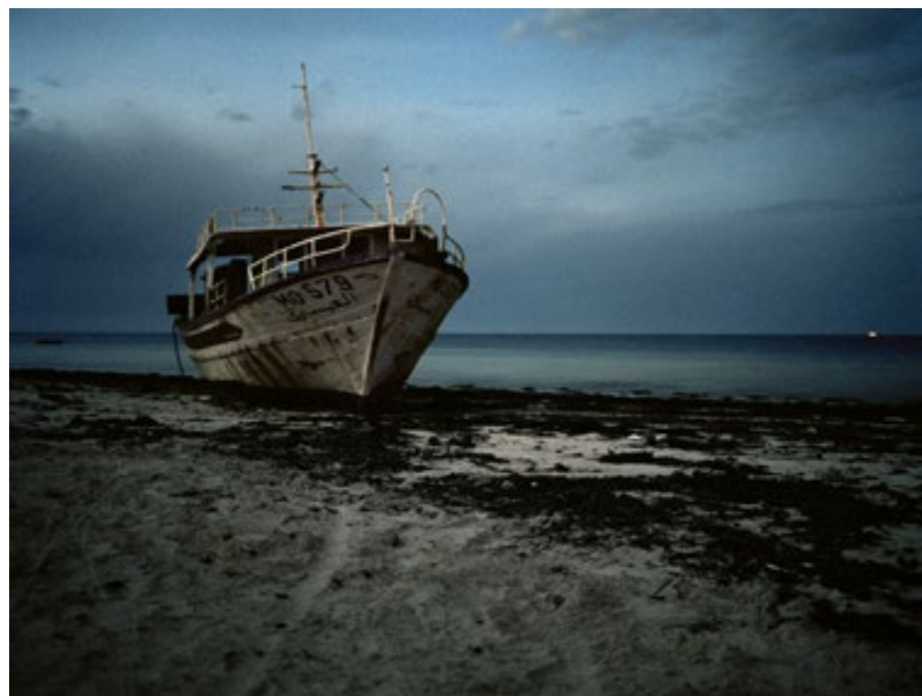
Zarzis, Tunisie, 2012. Bateau échoué près de ce port d'où sont partis beaucoup de Tunisiens après la révolution.

Toutes les personnes d'une même barque ne s'acquittent pas de la même somme, les contributions dépendent, en partie, des capacités financières de chacun et du nombre de passagers. Le rôle joué dans l'organisation de la traversée et la proximité avec le noyau central ont leur importance. Certains ont un rôle moteur : ils sont impliqués dans l'organisation et l'achat de l'équipement, d'autres ne sont contactés qu'une fois que le projet est bien avancé.